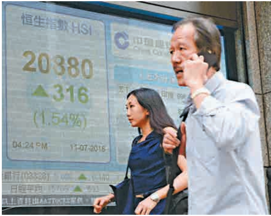
▲日本執政聯盟贏得國會大選，日股大漲近4%，加上美股上周五造好，恒指昨大裂口高開387點，最後高收316點

另一方面，英國脫歐後遺症短線風險不大；意大利銀行暫時並不構成威脅（這可從當地銀行CDS情況可窺一斑）；美聯儲本季加息機會微；內地本周陸續公布經濟數據，即使遜於預期，也屬市場不會感到意外；凡此種種，港股今季反覆向上的機率較大。