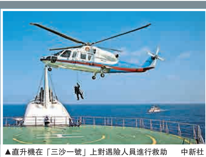
▲直升機在「三沙一號」上對遇險人員進行救助

談判。他還強調，「戰爭並非選項」。拉莫斯在杜特特致辭後接受媒體採訪時則表示，尚未接到杜特特的正式邀請，他聽到杜特特的話時也感到意外。拉莫斯稱，自己目前在忙於寫作，中國是他感興趣的地方之一。