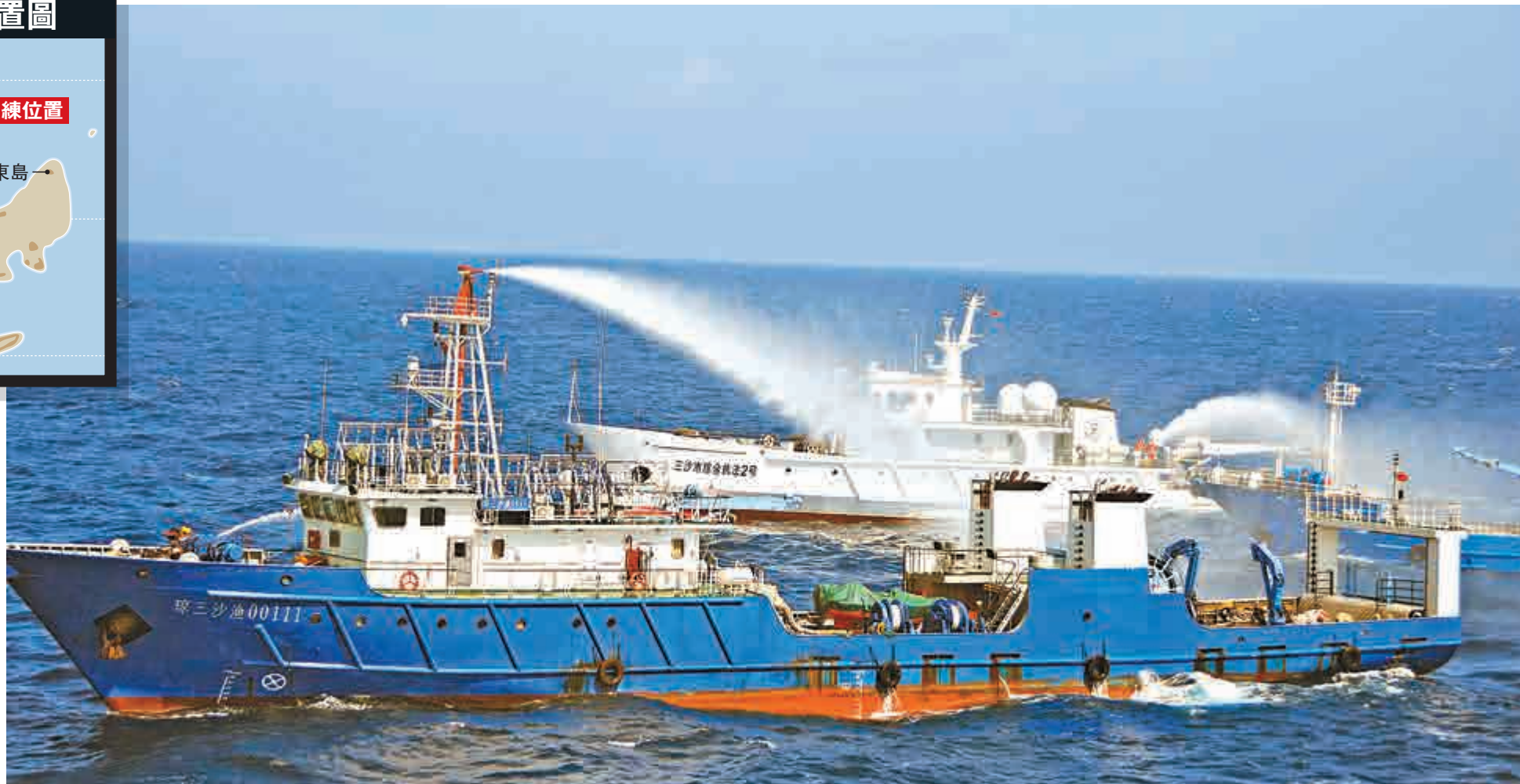
▲14日，三沙海域首次舉行多科目綜合性搜救演練，模擬撞船事故搜救行動