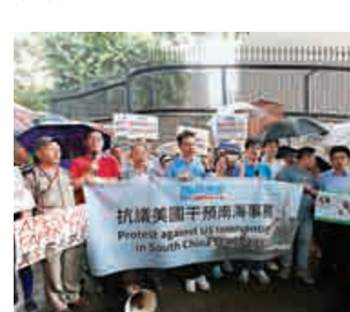
▲ 14日，三沙海域首次舉行多科目綜合性搜救演練，模擬撞船事故搜救行動

【大公報訊】實習記者鄒長婷報道：就美國為海牙仲裁法院有關南海諸島裁決發聲明一事，民建聯一行40多人14日到美國駐港領事館門外抗議及遞交請願信，重申不會承認有關裁決，要求美國立刻停止干預南海事務。