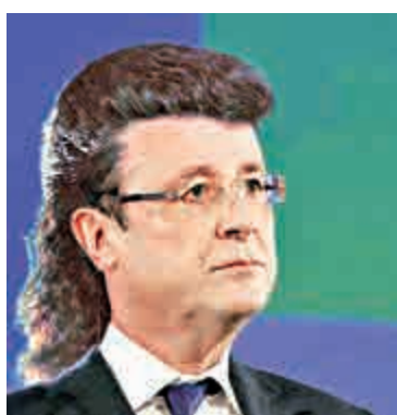
▲網民惡搞為奧朗德設計髮型 網上圖片

有網民惡搞，在社交媒體推特上，諷刺奧朗德的髮型不值得這價錢，幫他設計髮型，將他和揮霍無度的路易十六相提並論，甚至有網民認為下屆應由一個沒有頭髮的總統出任，可省回不少公帑。