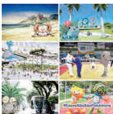
▲里約市長帕耶埃斯在推特上呼籲Pokemon Go盡早登陸巴西