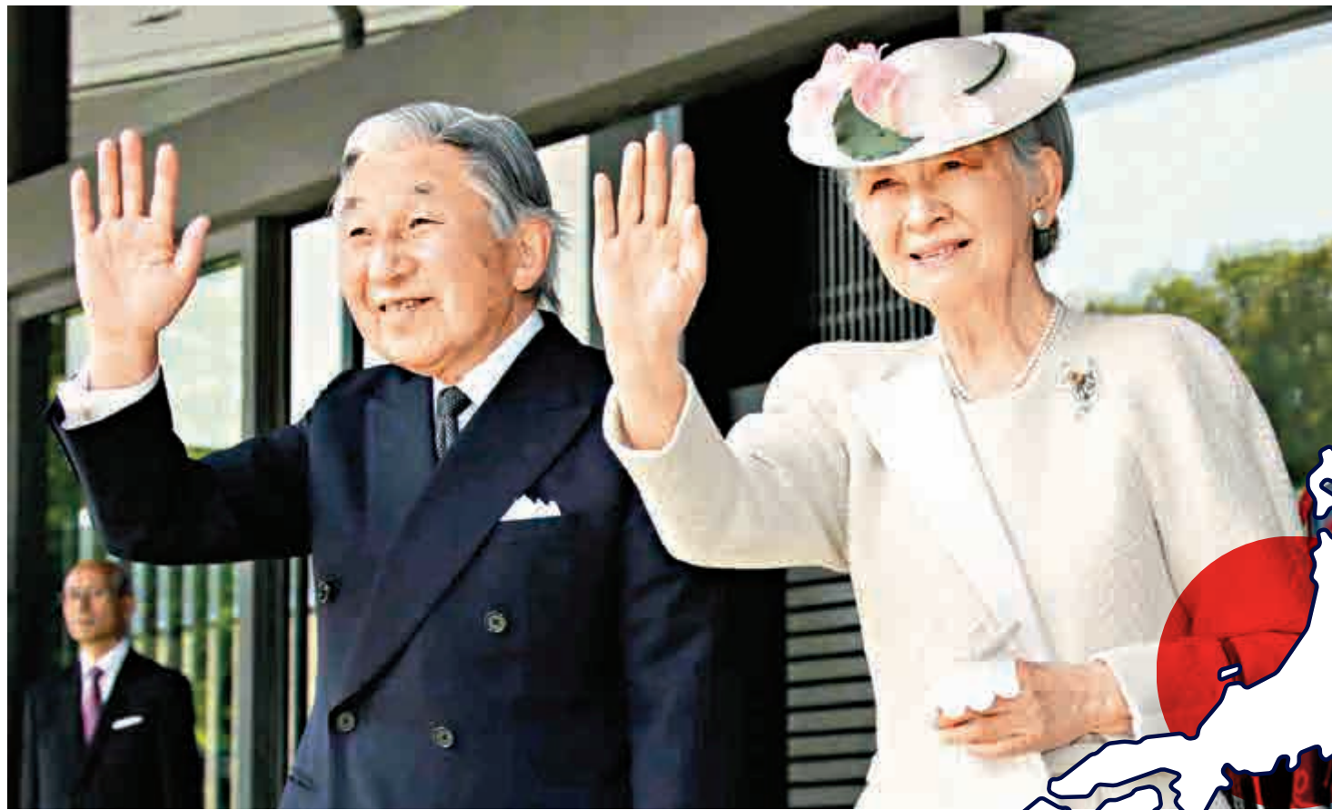
▲明仁天皇和美智子皇后