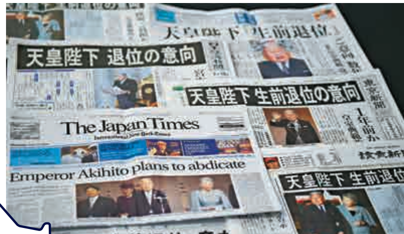
▲日本報紙爭相報道天皇提前退位的消息，但稍後被宮內廳否認

【大公報訊】綜合NHK、《朝日新聞》、《日經中文網》報道：日本宮內廳多位相關人員13日向日媒透露，高齡82歲的明仁天皇近日表示，想在生前把皇位傳給皇太子德仁親王，但宮內廳次長山本信一郎稍晚否認此一消息。