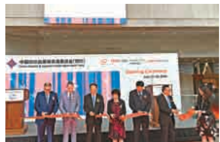
▲第十七屆中國紡織品服裝貿易展覽會在紐約賈維茨會展中心開展

有參展企業對記者表示，近年來國內棉花價格波動，人工成本上升，融資渠道不暢，紡織行業在國內面臨著艱巨的挑戰。在爭取國際市場方面，中國企業面臨著東南亞等一些勞動力成本較低的國家的競爭，中國紡織企業面臨著更新換代的壓力。因此，如要保住外貿市場份額，就必須不斷增強產品的競爭力，打通和縮短海外市場通路。