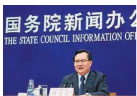
▲中國國家統計局新聞發言人盛來運在國新辦發布會上對上半年中國經濟的表現進行點評

另據中新社報道，上半年中國居民人均可支配收入扣除價格因素實際增長6.5%，這一增速低於同期中國GDP6.7%的增長速度。在一季度中國居民收入兩年來首次「跑輸」GDP之後，上半年居民收入增速再次出現低於GDP增速的情況。自2014年一季度國家統計局公布城鄉一體化住戶調查結果以來，在其所公布的數據中，中國居民人均可支配收入增速連續兩年「跑贏」GDP。但今年以來，這一趨勢被打破。