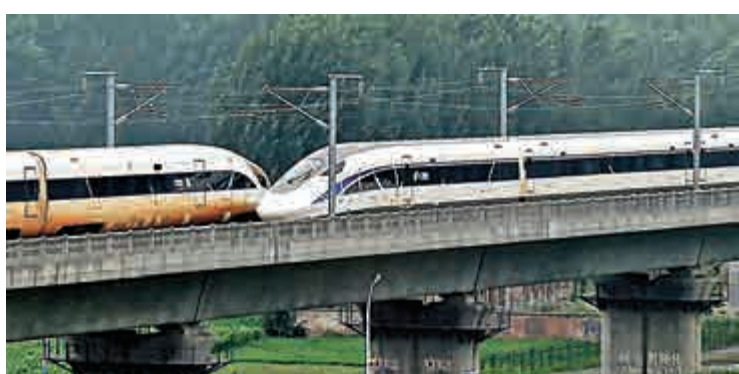
▲中國標準動車組「金鳳凰」（左）和「海豚藍」分別以420公里的速度交會而行，這是世界最高速的動車組交會試驗

值得一提的是，在新設立企業中，服務業企業大增，特別是信息、文化、教育等新興服務業快速增長。上半年，第三產業新登記企業212.4萬戶，同比增長30.2%，佔新登記企業總數的81.1%。商事制度改革從以往的「重審批輕監管」轉變為「輕審批重監管」，國務院組織多家機構進行的第三方評估顯示，在各項改革任務中，商事制度改革的滿意度超過了九成。