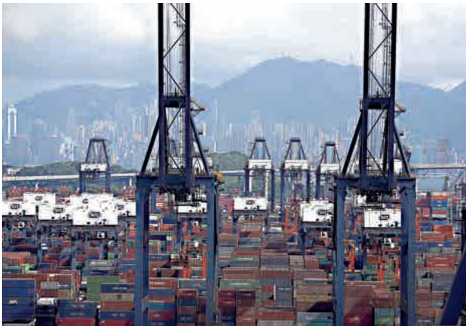
香港碼頭近年吞吐量(萬箱)

深圳港方面，上月貨櫃量跌4.29%至193.95萬箱，上半年跌1.2%至1143.5萬箱；寧波港上月跌8.22%至183.83萬箱，上半年增長2.8%至1079.01萬箱。至於首季貨櫃量趕超香港、晉身全球第五大港口的青島港，上月貨櫃量升2.11%至152.6萬箱，上半年則升4%至893.21萬箱，落後本港近23萬箱。