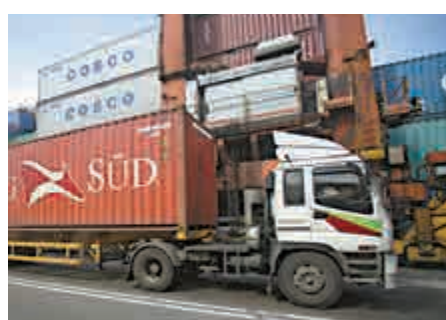
▲本年貨櫃吞吐量料不足二千萬個標準箱