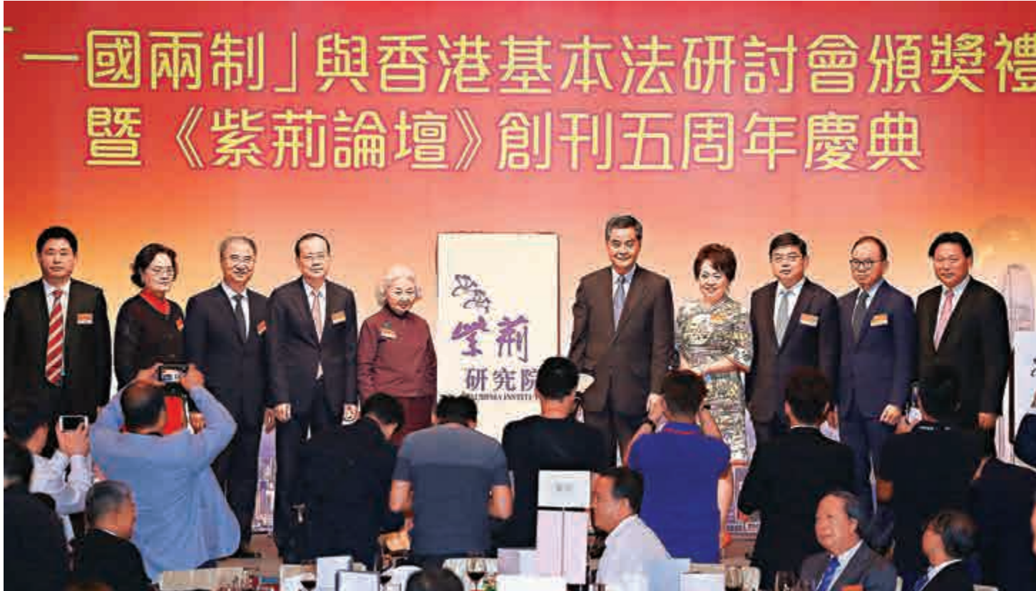
▲紫荆雜誌社、港澳基本法研究會舉辦的「一國兩制」與香港基本法研討會頒獎禮暨《紫荆論壇》創刊五周年慶典昨日舉行，多位嘉賓出席

楊勇則表示，香港若要長期維持繁榮穩定、發放「東方之珠」的光芒，便一定要長期堅持和實現「一國兩制」，真正的與國家和內地同胞一同共同邁向國家偉大復興及光輝的明天。