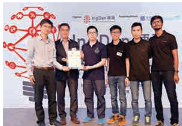
▲「硬蛋IOT基金」首場遴選會的亞軍團隊

擔任評審委員之一的香港智慧城市召集人楊全盛透露，聯盟剛與硬蛋簽署合作協議，共同為香港建設智慧城市，他對硬蛋設立IOT基金表示大力支持，因為物聯網的應用對於發展智慧城市尤其重要，聯盟未來更會向政府就建設智慧城市提交建議書，規劃未來10年的智慧城市發展藍圖。