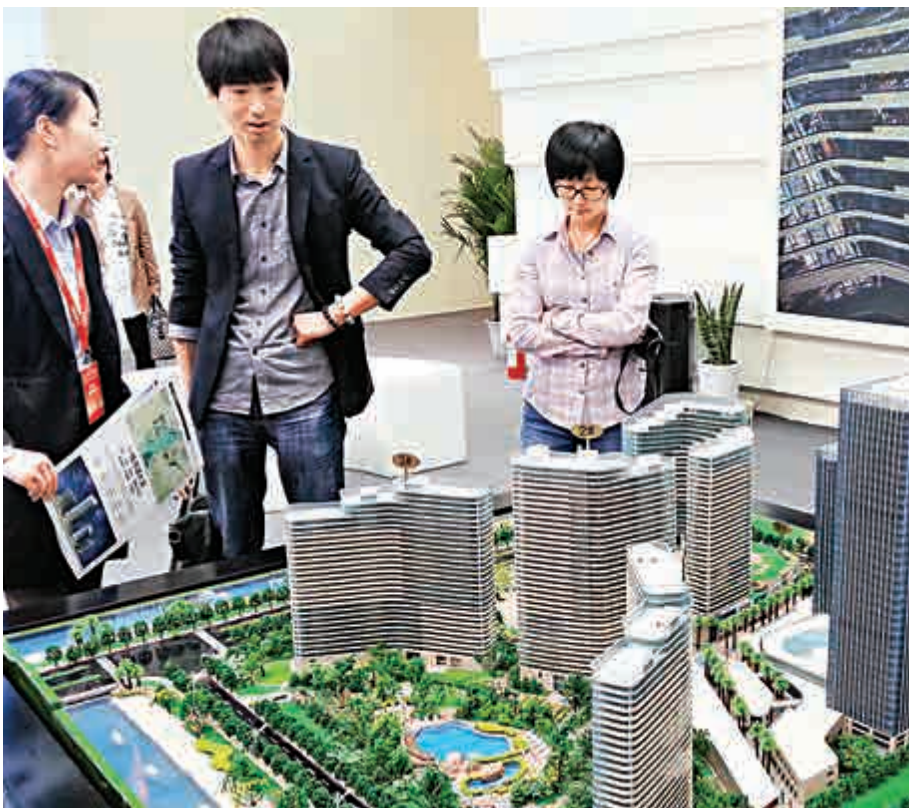
▲數據顯示，上月70城房價環比上漲城市個數繼續減少，且漲幅持續收窄；同比來看，房價上漲城市個數雖仍增加，但漲勢已有所放緩

內地70大中城市房價環比上漲城市個數續減，且漲幅持續收窄。外電根據國家統計局公布數據測算，上月70個大中城市新建住宅銷售價格環比上漲0.8%，雖是連漲14個月，但漲幅較五月收窄0.1個百分點；同比升7.3%，連續第九個月上漲幅度擴大。分析認為，二線城市房價續漲，但一線房價總體仍有擴大趨勢。也有分析稱，本月是傳統的成交淡季，成交面積大概率會繼續下滑，價格也會隨之回落。