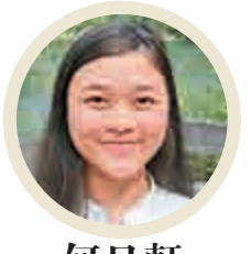
何日軒 香港珠海學院

習慣了香港人山人海的氛圍，一到蘭州就覺得這裏街道很寬、非常舒服。我非常期待體驗秦腔，賈平凹的《秦腔》描寫得蒼涼而有力，特別想親眼看一下，因為其他地方秦腔比較少。