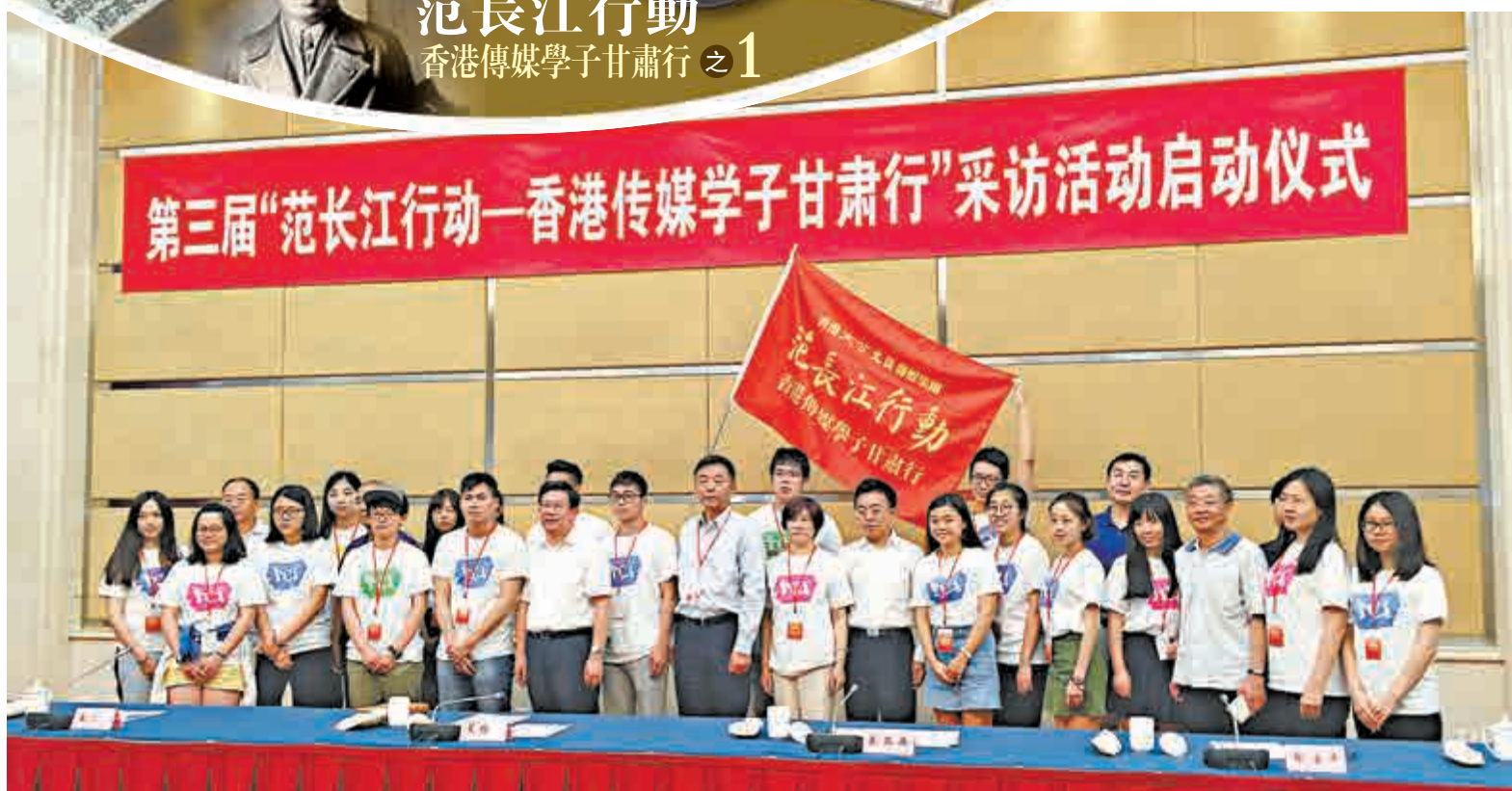
▲27日，范長江行動香港傳媒學子甘肅行啟動儀式在蘭州舉行