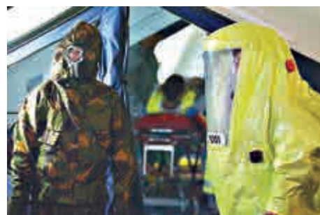
ISIS 襲擊里約奧運的威脅越來越大 網上圖片