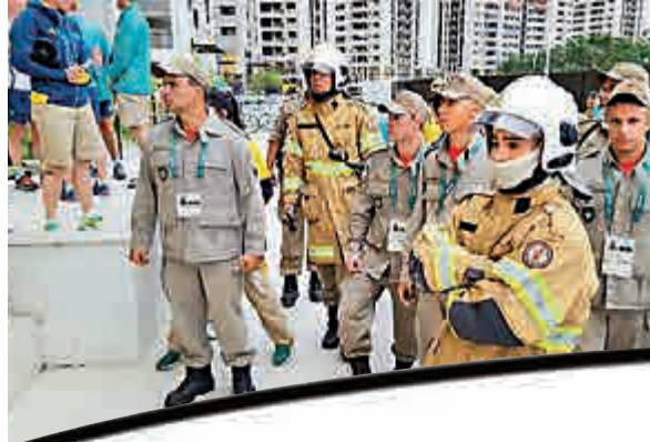
消防員上周五抵達澳洲 隊宿舍樓下