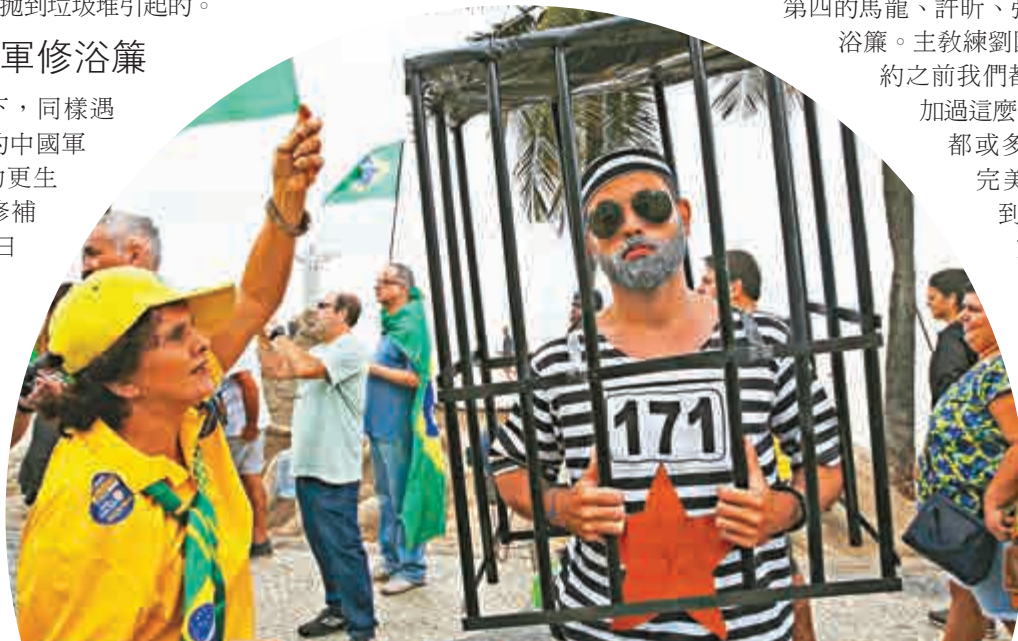
示威者7月31日要求囚禁總統羅塞夫

相比之下，同樣遇到住宿問題的中國軍團，則「自力更生」為奧運村修補漏洞。7月28日下午，中國乒乓球隊入住奧運村，發現房間內部的衛