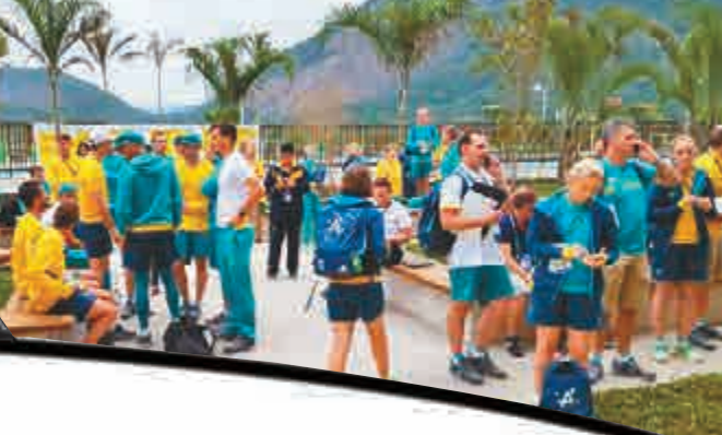
澳洲隊員因為火警一度疏散