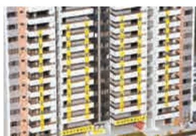
奧運村為澳洲代表團準備的宿舍

男子乒乓球世界排名第一、第三及第四的馬龍、許昕、張繼科紛紛上陣修浴簾。主教劉國梁表示：「來里約之前我們都有思想準備，參加過這麼多屆奧運，每一次都或多或少會有一些不完美，這些不會影響到我們，我們把心態調整好就好。」為了防範傳播寨卡病毒的伊蚊，中國代表團則祭出「撒手鐮」——