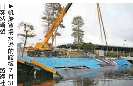
帆船賽場水邊的踏板 7月31日突然斷裂

上個月，國際核專家警告，目前針對歐洲城市的「襲擊」襲擊的威脅正處於歷史最高水平，甚至高過冷戰時期。今年三月，比利時恐嫌兄弟也被發現，曾經監視一名核電站官員，似乎是在謀劃針對核電站的襲擊。