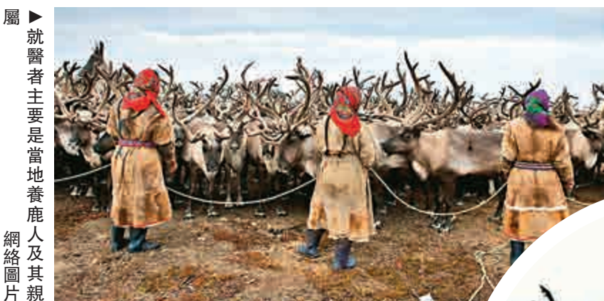
屬 ►就醫者主要是當地養鹿人及其親屬