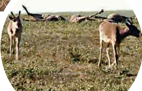
▲當地已有超過2300頭鹿因感染炭疽桿菌死亡