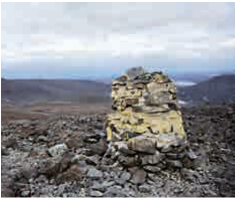
▲挪芬邊境的哈爾蒂山峰頂

目前看來，不論在芬蘭還是在挪威，民眾都對此提議持正面態度，只有北歐原住民薩米人例外，他們放牧的麋鹿在國界兩邊自由往來，向來主張這塊土地不屬於挪威也不屬於芬蘭。挪威薩米人議會主席凱斯基塔洛指出，薩米人視哈爾蒂山為「神聖之地」，無關國界。