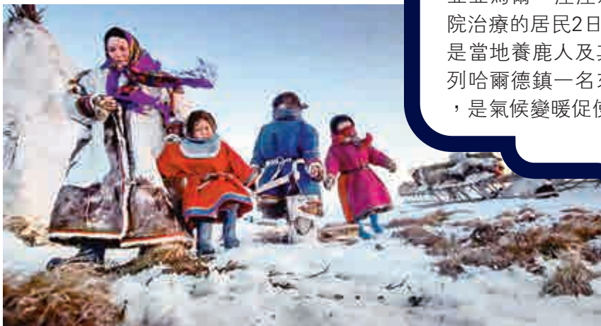
▲北極圈內薩列哈爾德鎮附近的一個家庭

【大公報訊】綜合英國《衛報》、新華社報道：俄羅斯西伯利亞亞馬爾—涅涅茨自治區爆發炭疽疫情，因疑似感染炭疽桿菌而入院治療的居民2日上升至90人，其中20人已經確診感染。就醫者主要是當地養鹿人及其親屬，其中50人為兒童。早些時候，北極圈內薩列哈爾德鎮一名來自養鹿人家庭的12歲男孩染病死亡。有專家認為，是氣候變暖促使炭疽病在近北極地區再次爆發。