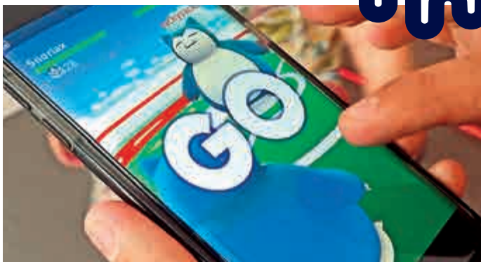
▲洛杉磯玩家在抓小精靈