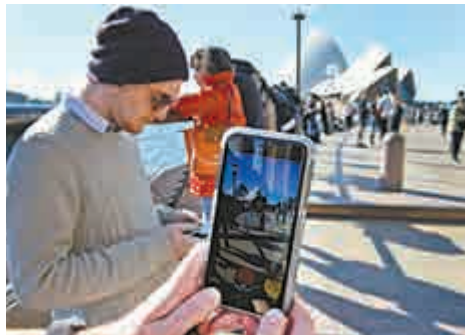
▲悉尼歌劇院前的Pokémon GO玩家