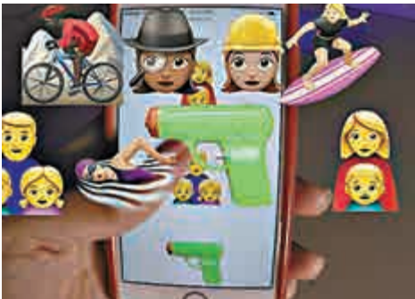
▲蘋果公司秋季將推新一組emoji

iOS 10將在今年秋季發表，iPhone和iPad所有用戶都可進行更新，將增加100多個新emoji和重新設計過的圖案。