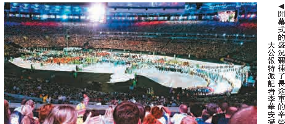
▲開幕式的盛況彌補了長途車辛勞 大公報特派記者李華安攝

抵達賽場更為划算。以剛完結的奧運開幕式為例，記者由傳媒中心到最後坐在馬拉卡納球場位置採訪開幕式，已需時超過三小時。當然，一位老前輩曾指點說過，「只要目標大於困難，一切都不成問題。」因此，能夠走訪森巴王國，為讀者提供第一手資訊、為現場為各路港將打氣略盡綿力，小小困難又算得上什麼？【里約熱內盧五日報導】