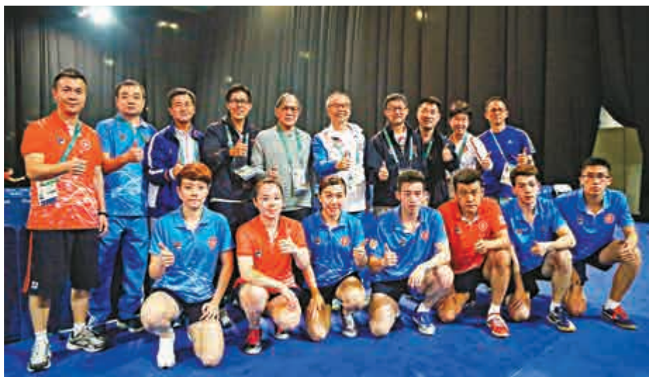
▲民政事務局局長劉江華（後排左六）、港協會會長霍震霆（後排左五）、香港代表團團長霍啓剛（後排左四）親臨場館為港乒隊打氣