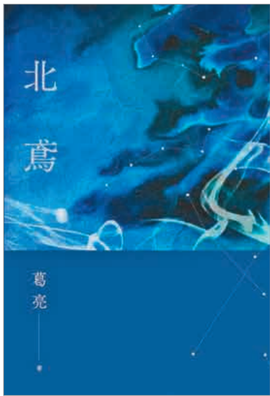
▲「中國三部曲」第二部《北鳶》，台灣聯經出版公司二〇一五年十月出版