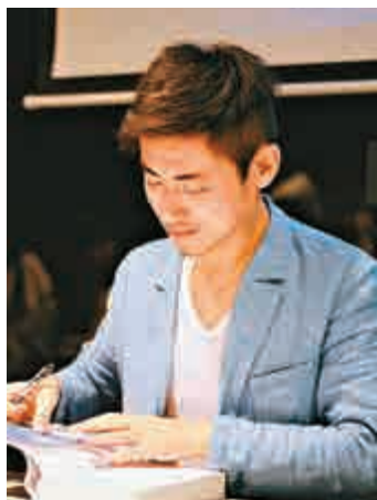
▲葛亮擅長書寫大時代的風起雲湧