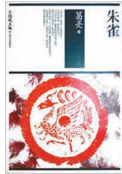
▲「中國三部曲」第一部《朱雀》，台灣麥田出版社二〇〇九年七月初版