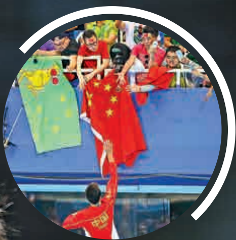
▲孫楊在賽後向粉絲致意

孫楊在2014年仁川亞運會前曾有過「涉藥」經歷，並被禁賽處罰3個月，但那次「涉藥」事件已被證明為誤服，是因為他幾年來不時出現心肌缺血情況，一直使用相關藥物改善症狀所致。而孫楊也遵照相關部門的指令接受了處罰。在禁賽期滿之後，他已恢復清白。