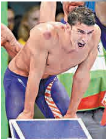
◀美國游泳名將菲比斯身上的拔罐痕跡惹關注

拔罐療法歷史悠久，早已在亞洲流傳，但歐美地區普遍不了解。媒體稱，菲比斯一向有拔罐習慣，甚至帶起美國運動員迷上拔罐的潮流。早前，美國體操運動員拿度亞，也在Instagram上載照片，展示他的拔罐紅印。