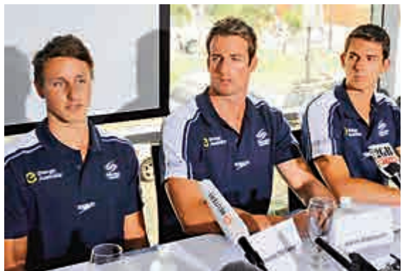
▲澳洲泳協2013年召開發布會承認服用禁藥 資料圖片

此後，澳洲泳協也發布調查報告稱，該國游泳隊之所以在2012年倫敦奧運會上的表現令人失望，是因為管理不善，存在着酗酒、濫用處方藥物和違反夜間管理規定等嚴重問題。