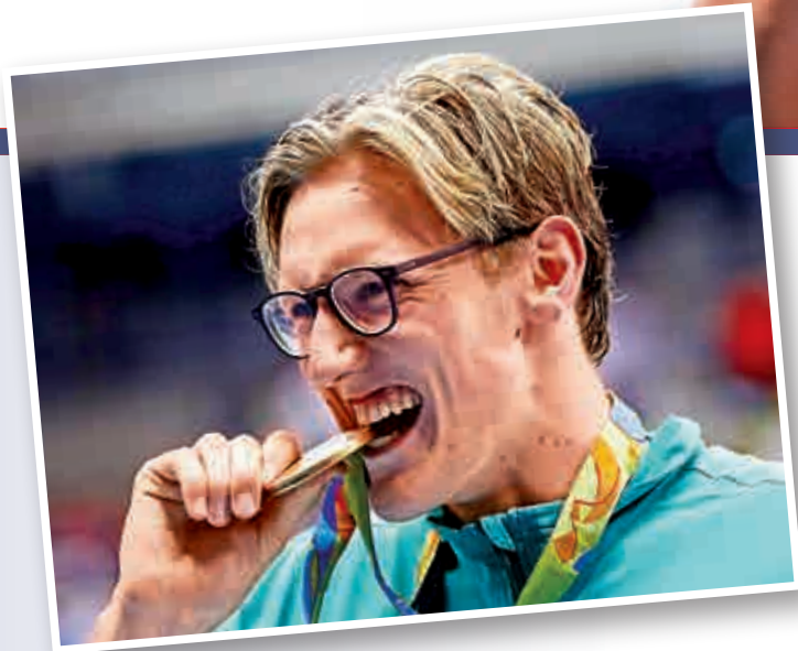
▲澳洲選手霍頓6日在里約奧運會男子400米自由泳決賽中獲得金牌