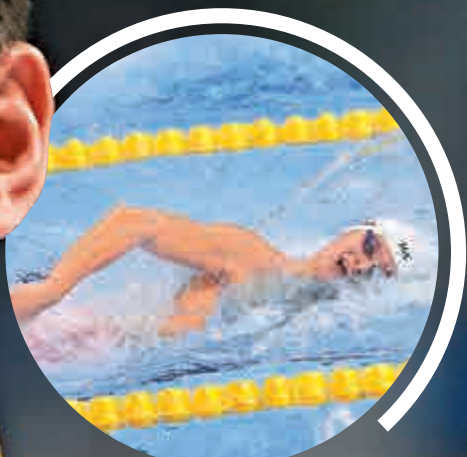
▲泳池內奮力前進的孫楊