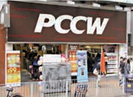
▲電訊盈科表示，已購入荷里活製片商STX Entertainment（STX）部分股權