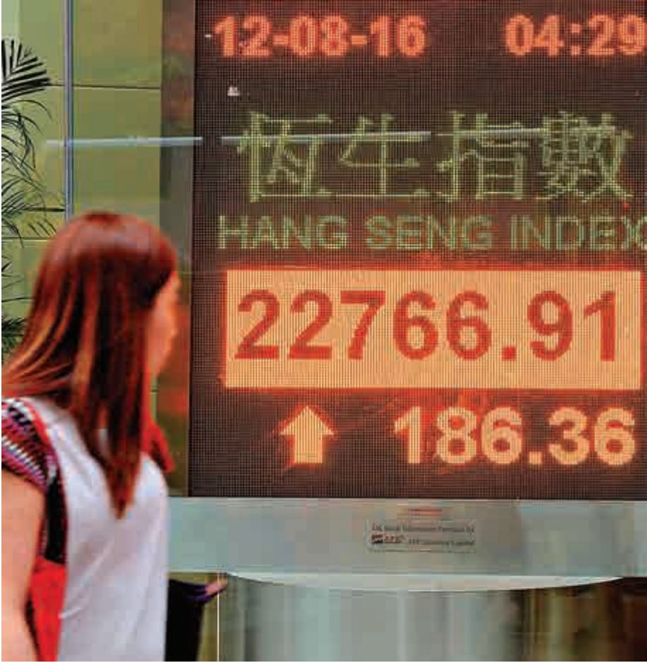
▲港股昨日再升近二百點，恒指創今年新高