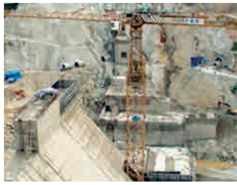
▲已停工多年的密松水電站工地

昂山素姬則回應指，對緬來說，中國是抱有善意的最大鄰國，緬方讚賞中國為緬經濟發展和民族和解進程提供的支持和幫助，值此緬發展建設的重要時期，希望中國作為緬的好朋友繼續予緬以支持。