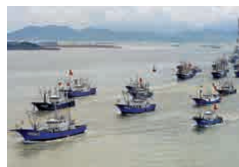
▲中國漁船出海作業 資料圖片

報導稱，獲准在朝方海域捕撈的中國漁船有2500多艘，中方以7500萬美元價格購買漁權。該數字比韓國國家情報院7月1日向國會情報委報告的規模還大。當時，國家情報院指出朝鮮以3000萬美元的價格，向中國出售今年的漁權，獲准在朝方海域捕撈的中國漁船有1500多艘，達到往年的3倍。