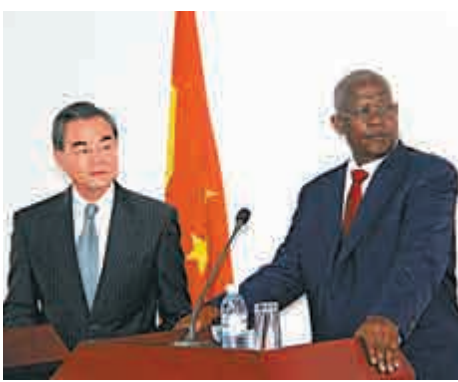
▲在烏干達首都坎帕拉，烏干達外長庫泰薩與來訪的中國外長王毅（左）會談後共見記者

【大公報訊】據中新社報導：11日，中國外交部長王毅在烏干達首都坎帕拉與烏外長庫泰薩會談。王毅在會談後與庫泰薩共見記者，他將中國為維護非洲和平穩定所作努力歸納為5個關鍵詞。