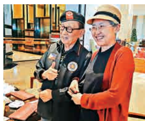
▲中國全國人大外事委員會主任委員傅瑩（右）與拉莫斯合影