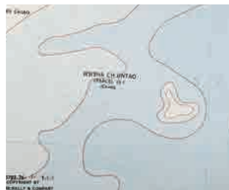
▲地圖集收有一幅「中國·東方」（China.Eastern）地圖，西沙群島位置用韋字拼音「HSISHA CHUNTAO」標註，PARCEL IS（帕拉塞爾群島）下面加註China