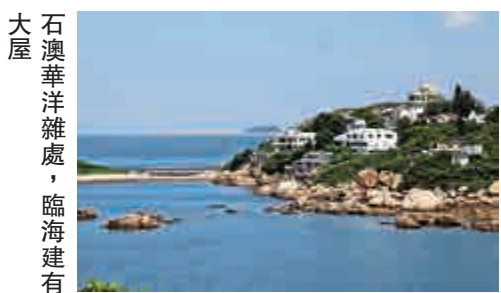
石澳華洋雜處，臨海建有

石澳村、大浪灣村和鶴咀村的村民來自多個不同姓氏，彼此關係密切。有些遷往石澳居住，有些互相通婚，有些在鄰村擁有田地和祖業。每次打醮是村民合作酬神的日子，同時亦使他們有機會聚首一堂聯誼。