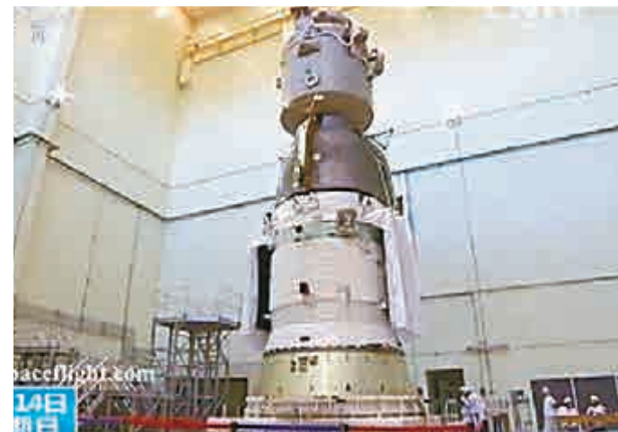
▲科研人員對神舟十一號進行測試