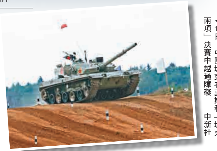
◀14日，中國坦克在莫斯科「坦克兩項」決賽中越過障礙