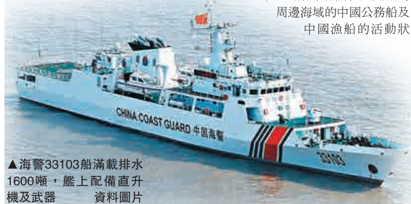
▲海警33103船滿載排水1600噸，艦上配備直升機及武器 資料圖片

此外，《讀賣新聞》援引海保方面消息稱，在黃尾嶼附近海面先後有6艘中國公務船放下橡皮艇靠近漁船。部分人員還登上漁船進行檢查。日本海保判斷，中國執法部門可能正依照中國法律行使執法權。