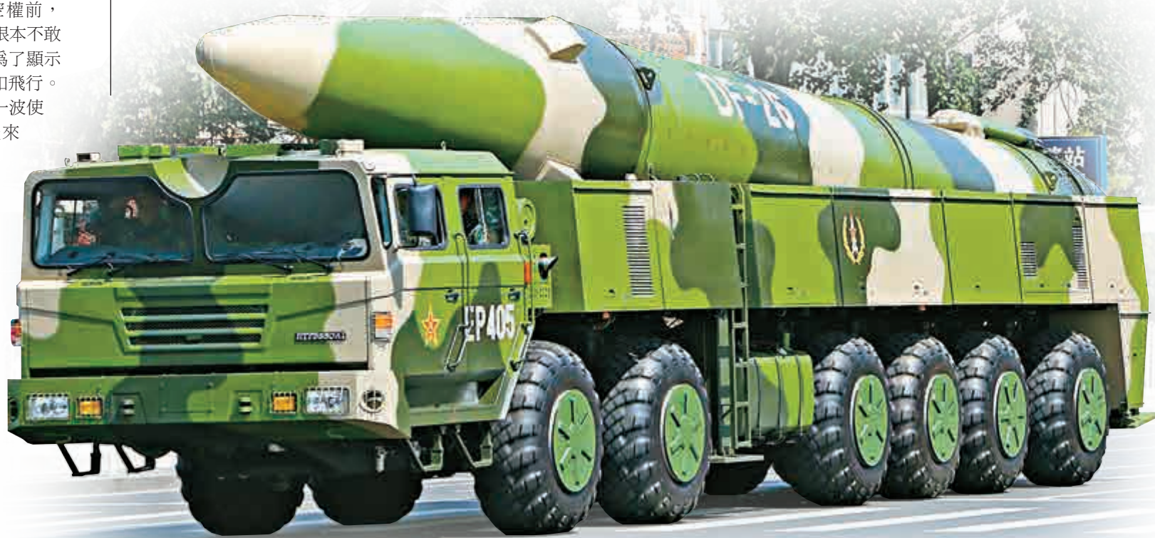
▲東風26中程彈道導彈有效射程覆蓋關島