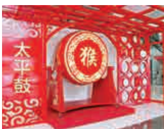
◀位於太平金融大廈一樓的太平鼓

【大公報訊】實習記者李佳斌報導：「噹、噹、噹」三下雄渾洪亮的鐘聲，在上海陸家嘴太平金融大廈頂樓敲響，像在闡述世人對太平的嚮往及在不懈追求太平途中的艱難歷程，祈求上蒼保佑，並詳敘中國太平創建之途。說起這個金鐘可有來頭，它是在2011年安裝，高二零八米，直徑約一點八米，重量約五噸。由上海交大中華青銅藝術工程股份有限公司設計製造，其匾額由上海玉佛寺方丈一覺醒大師手書「太平金鐘」四個字。這個金鐘頂飾如意紋，取其吉祥之意