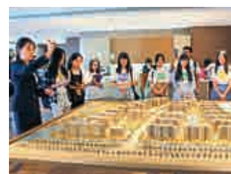
◀「梧桐人家」样板间的工作人員向傳媒學子介紹項目情況

創立於1929年的中國太平是中國歷史最悠久的民族保險品牌。經過87年的發展，已經成爲一