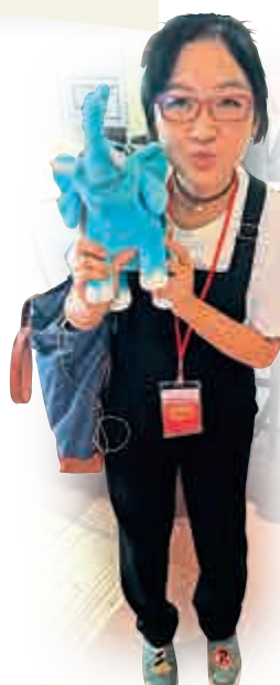
▶傳媒學子與「太平吉象」玩偶合影

2015年，中國太平保險集團深入挖掘中華民族傳統文化內涵，創意設計出新品牌形象「太平吉象」，整體形象設計精良，細節精緻，體現中國太平的精品理念。「太平吉象」整體形象憨態可掬、具親和力和祥和之意，身體珠圓玉潤，大耳朵為元寶形狀，腳趾成蓮花狀，寓意腳踏蓮花。象背寶瓶和如意鞍子均為藍綠漸變色並用金色溝邊，雕刻「太平吉象」四個字，配有祥雲暗紋，寓意太平如意、金玉滿堂。