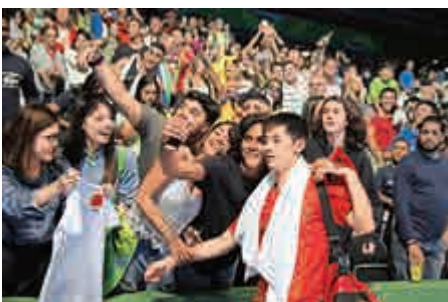
▲張繼科（前紅衣）離場前與熱情粉絲合照