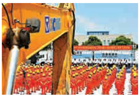
▲蘇通GIL綜合管廊工程開工現場

耗小、不受環境影響、運行可靠性高、節省佔地等顯著優點。包括清華大學、同濟大學、武漢大學、西安交大、西南交大、中國電科院、中鐵四院等數十家高校科研機構，參與了設備、涉水涉航、施工安裝和試驗、運修檢修及電力基礎等六大類46項課題的攻關。