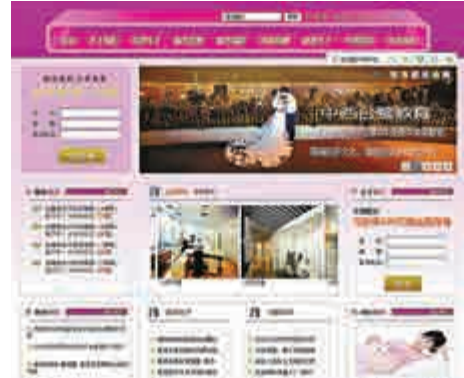
▲提供赴港事務服務的香港中介機構網站