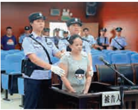
▲廣西特大跨國拐賣嬰兒案外籍女犯被執行死刑

【大公報訊】據中新社報道：經中國最高人民法院核准，廣西防城港市中級人民法院16日依法對「6·8」特大跨國拐賣