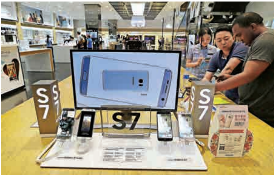
▲三星電子手機部門上季盈利按年勁漲57%，讓投資者感到驚喜

然而，三星與這些舊品牌不同，其智能手機業務捱過兩年艱難期後，現重拾行業的主導角色，手機利潤率實現16%水平，是2014年以來最高。過去數年，三星的利潤率被中