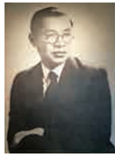
劉海粟年輕時的照片

以個人命名的省市級美術館——劉海粟美術館新館八月十八日已開館。作為海派藝術大師，劉海粟一生與香港有諸多不解之緣，在人生和學術生涯中亦與香港有多次交集，是港人所熟知的海派藝術家之一。為了向藝術大師致敬，新館的開幕大展命名為「再寫劉海粟」，展覽重新解讀重新審視，從新的視角來重新書寫在新文化歷史中的這位中國新美術運動的拓荒者、現代美術教育的奠基人。