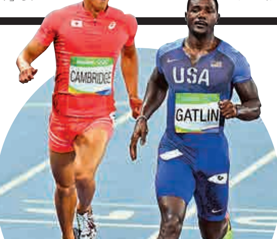
日本混血選手劍橋飛鳥（左）本屆奧運會表現出色