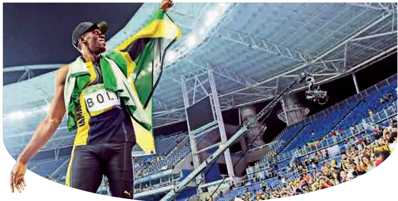
保特19日慶祝牙買加接力賽奪金

【大公報訊】綜合法新社、新華社及英國《每日郵報》報道：里約奧運田徑男子4×100米接力決賽，「閃電」保特壓軸助牙買加衛冕成功，個人在奧運會完成了史無前例的「三三」連霸，以九塊金牌為奧運生涯畫上完美句號。