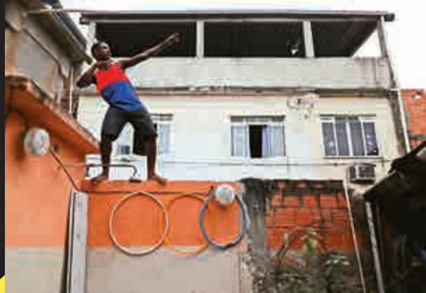
保特的標誌性動作