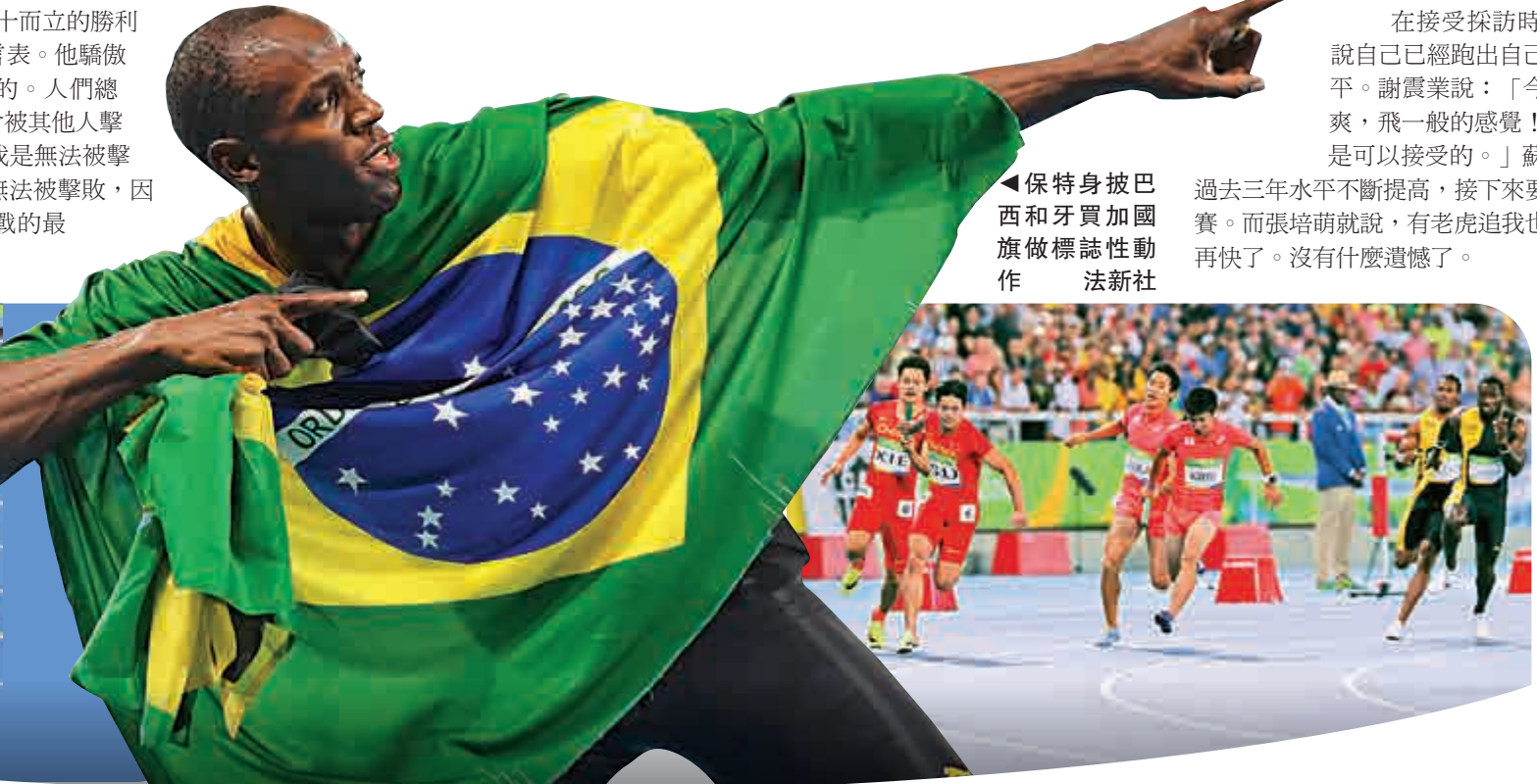
保特身披巴西和牙買加國旗做標誌性動作