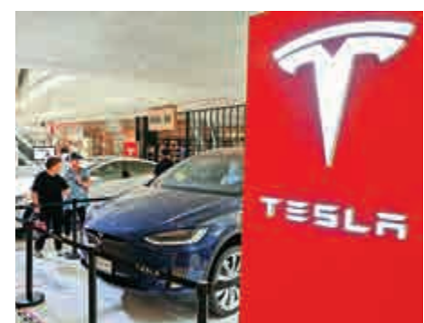
Tesla解釋，虧損主要是受汽車和電池工廠成本上升所拖累