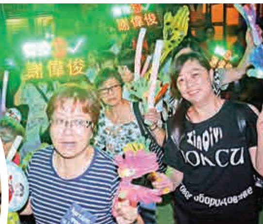
▲謝偉俊舉行造勢大會，獲市民支持