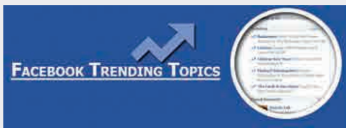
▲Fb的「趨勢話題」功能可為用戶列出熱門新聞內容 網上圖片