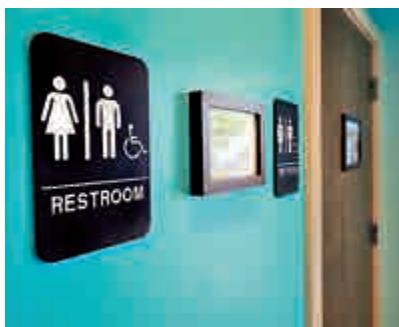
▲北卡州一間餐廳的洗手間外「男女通用」的標誌

北卡州州立大學的2名跨性別學生及1名跨性別僱員，此前就這一規定提出訴訟。法官在周五的判決中指出，州政府此舉違反了聯邦法，裁定此3人勝訴。