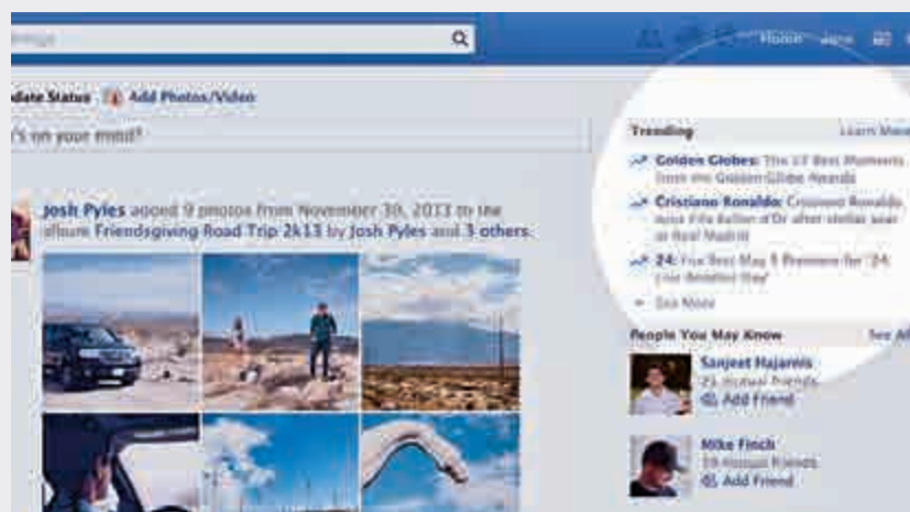
▲舊版的「趨勢話題」包含人為編輯的對新聞話題的描述 網上圖片