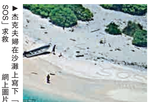
▲杰克夫婦在沙灘上寫下「SOS」求救

【大公報訊】據英國《每日郵報》報道：美國一對夫婦日前在駕駛小艇往來太平洋島嶼途中失蹤，經過進行一周的搜尋工作，兩人在一個無人島獲救。據美國海岸防衛隊稱，兩人在該島的沙灘上寫下了「SOS」字樣，搜索飛機發現這一求救信號，才得以成功施援。