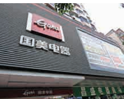
▲國美電器盈利急跌

國美電器今年3月完成向大股東黃光裕收購非上市資產，令門市數目由約1220間增至近1800間。其中，集團在一級市場門店總數為941間，上半年銷售收入增長7.6%，二級市場門店總數為786間，銷售收入升近25%。國美電器總裁王俊洲表示，集團將持續推進戰略轉型，通過整合互補性優質資源，形成新的場景，推動多業態、全品類零售生態圈。