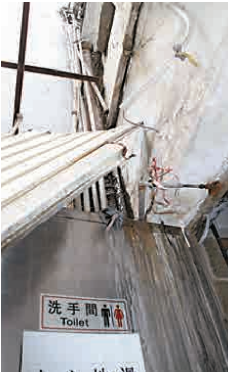
▲旺角一幢舊樓水錶被偷走

表示，髮型屋開業至今近60年，他是第三代傳人，大廈過往亦曾發生類似事件，但因今次連續無水供應，髮型屋生意大降八成。