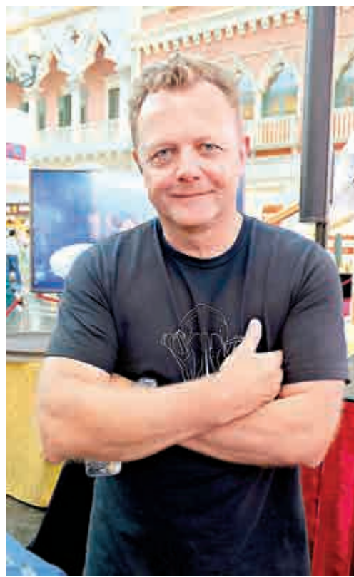
▲STOMP創辦人之一Luke Cresswell

STOMP澳門演出門票現於金光票務（www.cotaiticketing.com）、快達票（www.hkticketing.com）、澳門廣星傳訊（www.macaoticket.com）發售，逢星期一休演。又訊，STOMP由六月二十九日至九月四日，於北京解放軍歌劇院駐場演出合共七十場（內地節目名「破銅爛鐵」）。