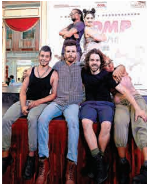
▲STOMP澳門表演團共有八人，其中六人出席預演