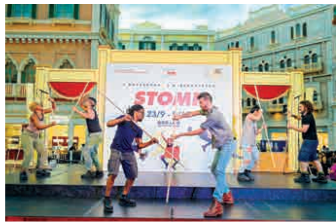
▲STOMP在澳門威尼斯人聖馬可廣場率先預演 金沙中國有限公司供圖