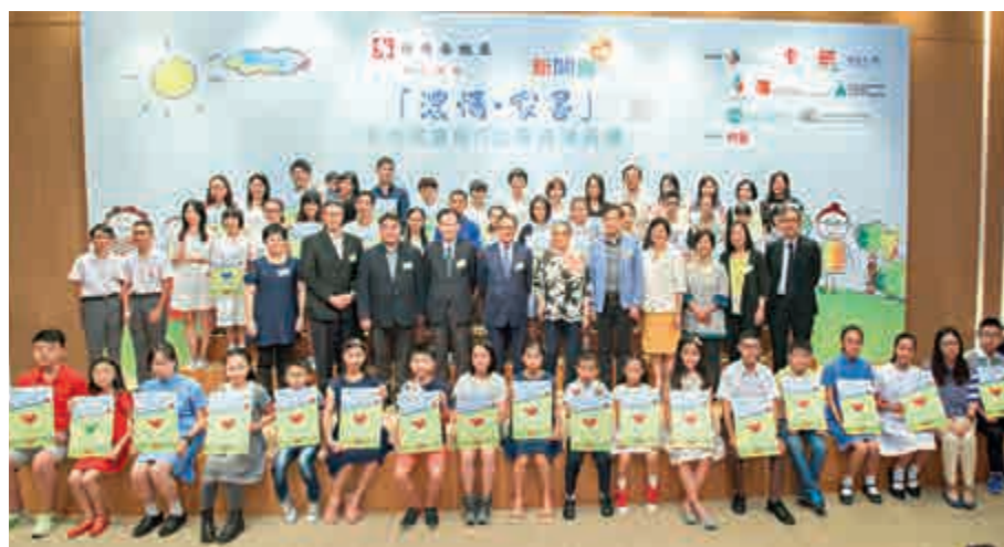
▲新地閱讀寫作比賽得獎者與嘉賓合照