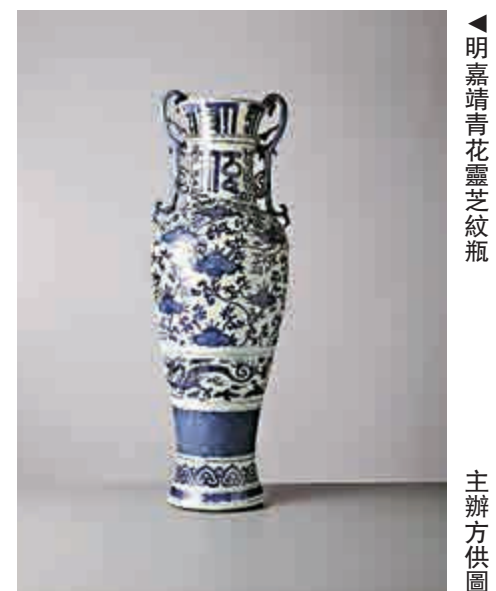
▲明嘉靖青花靈芝紋瓶

典亞藝博於二〇〇六年成立，展品範疇統括古今中外不同時期之藝術精品。二〇一五年度的典亞藝博會場展出了逾八百件藝術品，總估值超過港幣二十八億元，共吸引了二萬五千八百名來自世界各地的訪客到場參觀。