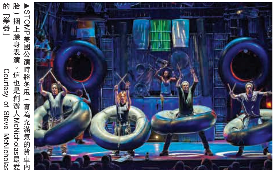
▲STOMP美國公演時將冬用（實為充滿氣的貨車內胎）擱上腰身表演。這也是創辦人McNicholas最愛的「樂器」