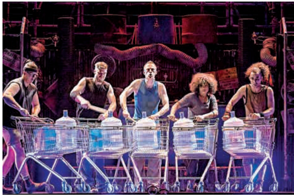
▲純淨水桶、超級市場購物車都可以是STOMP奏樂的道具