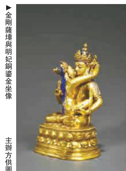
▲金剛薩埵與明妃銅鑲金坐像

作為典亞藝博成立以來一席不落的常客，Rossi & Rossi（倫敦和香港）這次帶來的銅鑲金剛薩埵與明妃坐像，是今年