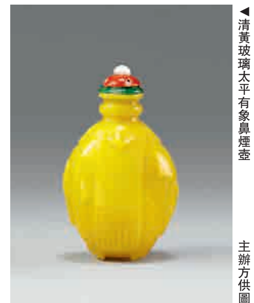
▲清黃玻璃太平有象鼻煙壺