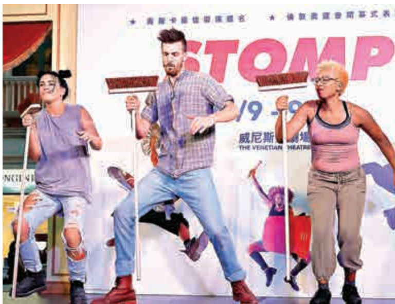
▲STOMP用掃把炮製獨特音效