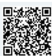
更多內容歡迎掃描二維碼，瀏覽大公網「港東港西」專題