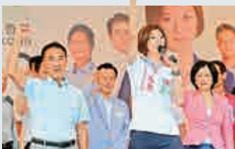
▲田北辰（左）、葉劉淑儀（右）為Eunice拉票 資料圖片