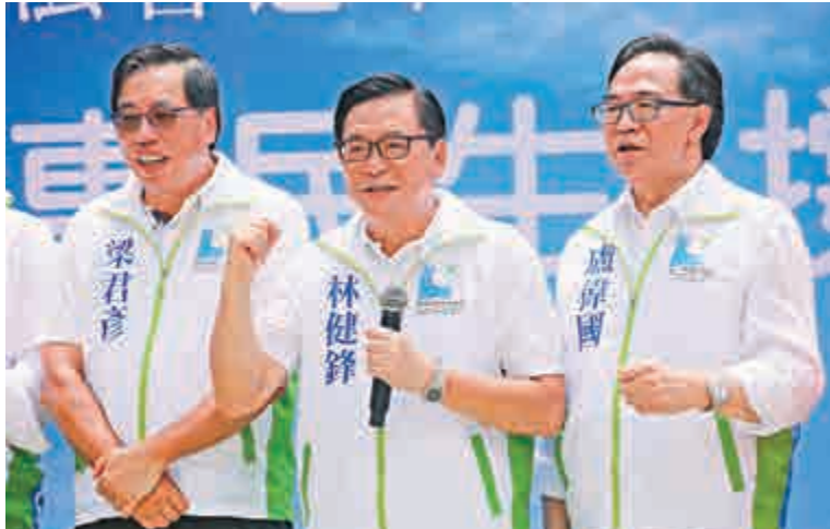
▲林健鋒（中）為工商界發聲