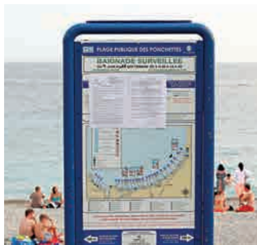
▲尼斯海灘上豎起的「布堅尼禁令」

目前市場上，索尼旗艦機Xperia XZ也才剛亮相，主打「三重影像感測技術」相機、全球首款五軸防手震錄影功能，而預計要以中階應戰的則有宏達電推出的A9s，以及預計在9月20日量產的Desire 10系列和10月中旬可望推出的Google Nexus系列。三星這一季倒下，並不意味着蘋果一定是最大受益者。