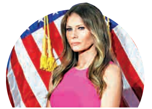
▲特朗普妻子梅拉尼婭

梅拉尼婭今次委任的律師哈德大有來頭，早前曾替退休捧角明星霍根，成功向美國八卦媒體Gawker，索償1.4億美元。Gawker因發放霍根和一名朋友妻子性交的影片，而惹上官非，最終要關閉旗艦網站。