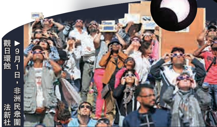
▶9月1日，非洲民眾圍觀日環蝕