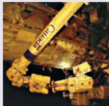
▲國際太空站外部

【大公報訊】據法新社報導：9月1日，兩名美國太空人登上國際太空站(International Space Station, ISS)，成功完成修復及安裝新設備的工作。