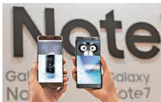
▶消費者在首爾三星專門店使用Note 7手機

高東真表示，截至9月1日，三星在韓國國內外服務中心共接到35宗充電電池報告，這相當於100萬部中有24部存在缺陷。手機爆炸起火原因，高東真表示，分析發現電池存在缺陷，才做出召回決定。韓聯社指，這是三星電子首次決定召回大量智能手機。