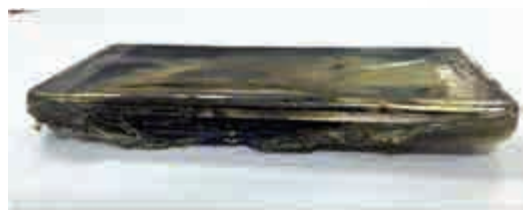
▲三星Note 7手機(下)及其電池爆炸後的樣子(上)

【大公報訊】據《華爾街日報》、路透社報導：三星行動通訊事業部總裁高東真9月2日召開記者會，對當日在美國紐約發布旗艦型智能手機Galaxy Note 7電池存在缺陷正式道歉，並宣布將召回這款手機。不過三星香港發言人稱香港會按原定計劃，2日起正式發售Note 7，Note 7在香港和中國內地的行貨銷售均未受到事件影響。