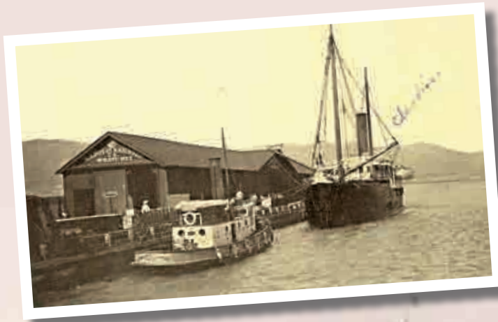
▲茂宜島卡胡盧伊港及停泊在岸的環島船隻「Claudine」