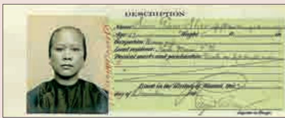
▲孫眉夫人譚氏於一九〇八年夏威夷的身份證明

資料來源：一九〇九年一月十五日花旗東西輪船公司「西伯利亞號」（S.S. Siberia）的登船記錄