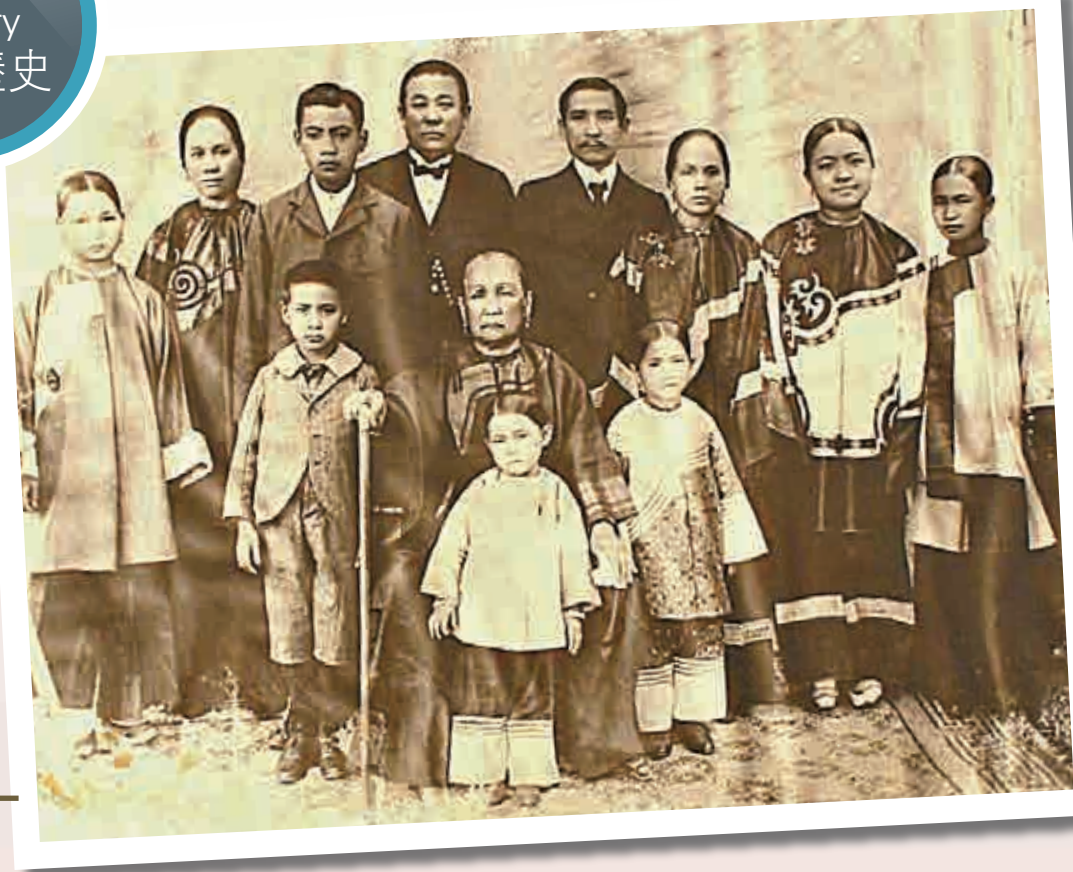
▲一九〇一年孫中山（後排右四）在夏威夷與家人合照，前排中坐者為楊太夫人

然而，馮自由並非當事人，透過口耳相傳記錄下來的資料不無問題。夏威夷和香港報章，以至美國和日本等地的塵封檔案為我們提供了線索，讓我們可以更接近歷史真相。