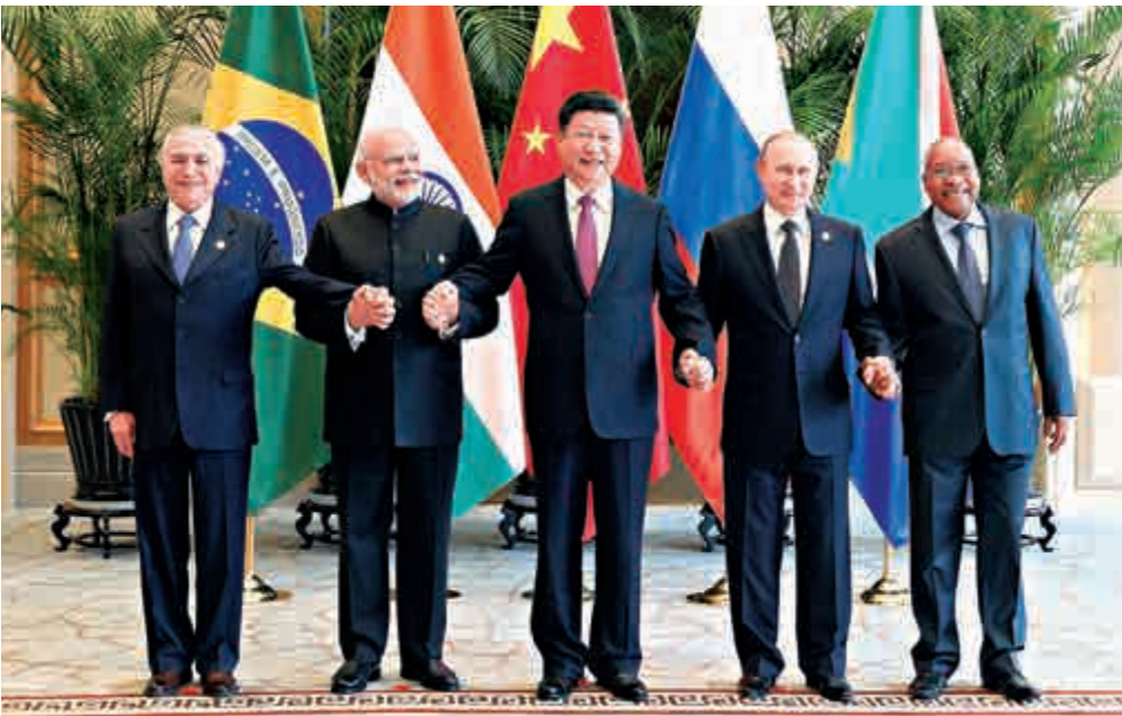
金磚國家領導人非正式會晤在杭州舉行