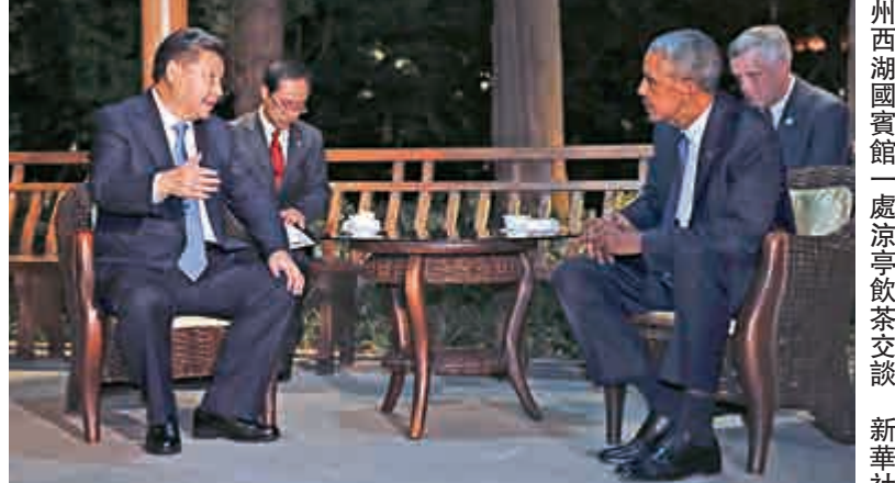
中國國家主席習近平與美國總統奧巴馬在西湖國賓館一處涼亭飲茶夜談