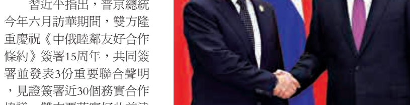
國家主席習近平在杭州會見出席二十國集團領導人杭州峰會的俄羅斯總統普京

【大公報訊】據新華社報道：中國國家主席習近平4日在杭州會見俄羅斯總統普京，並歡迎普京來華出席二十國集團領導人杭州峰會。 習近平指出，普京總統今年六月訪華期間，雙方隆重慶祝《中俄睦鄰友好合作條約》簽署15周年，共同簽署並發表3份重要聯合聲明，見證簽署近30個務實合作協議。雙方要落實好此前達成的各項共識和協議，推動各領域合作不斷發展。 習近平強調，雙方要加強全方位戰略合作，堅定支持對方維護國家主權、安全、發展利益的努力，積極推動兩國發展戰略对接和「一帶一路」建設同歐亞經濟聯盟建設有效對接，推進基礎設施建設、能源、航空、高新技術等領域務實合作，加強軍事交流和安全合作。要密切在國際和地區事務中的協調和配合，堅決維護聯合國憲章宗旨和原則及國際關係基本準則。