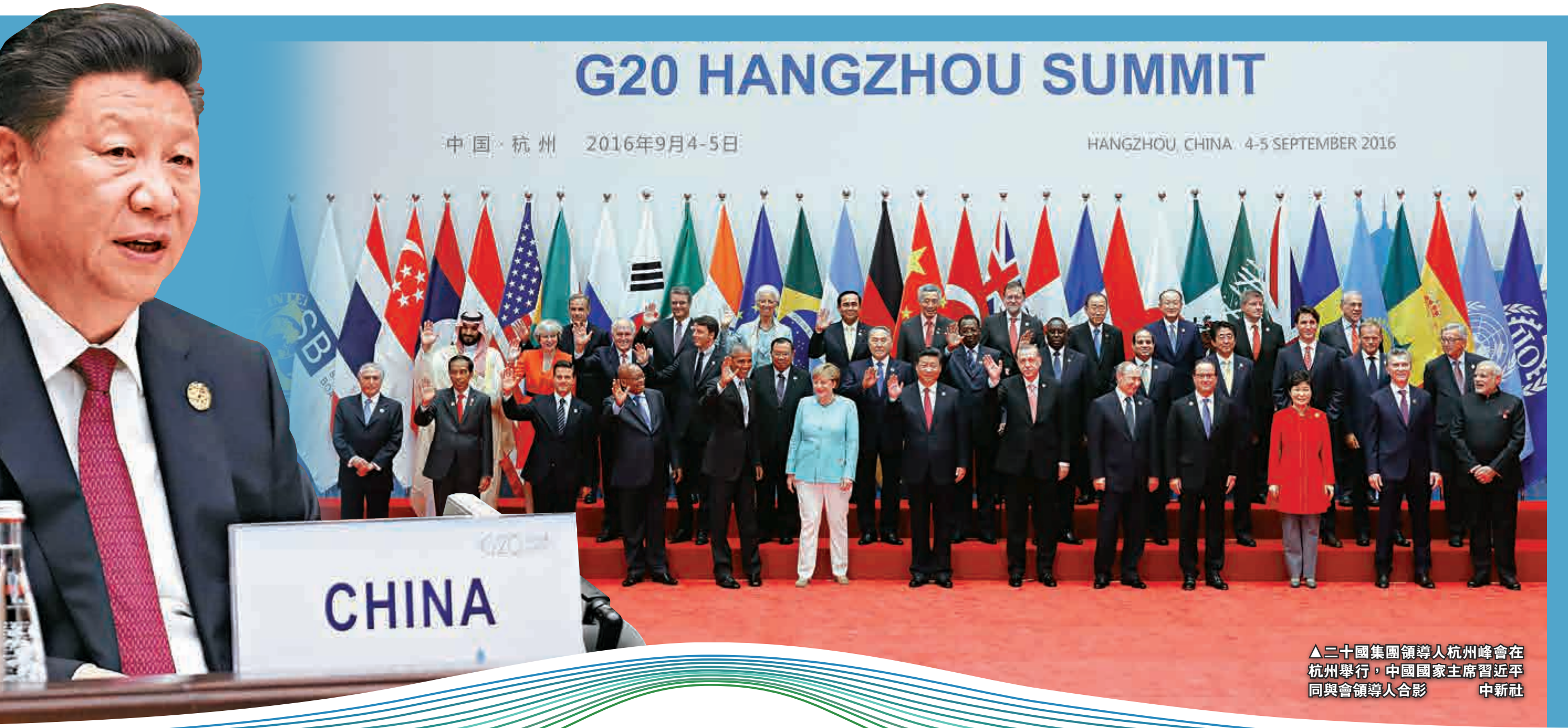
二十國集團領導人杭州峰會在杭州舉行，中國國家主席習近平與會領導人合影