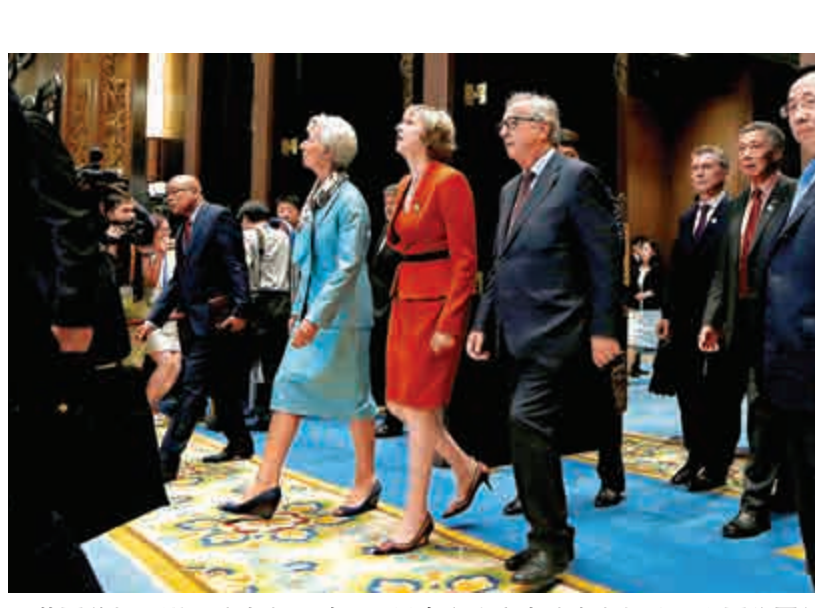
英國首相文翠珊（中）、歐盟委員會主席容克（右）抵達二十國集團領導人杭州峰會開幕式

【大公報訊】3日，即將前往中國參加G20杭州峰會的英國首相文翠珊在出發前強調，英中關係目前正處於「黃金時代」，她將在峰會期間與中國領導人會談，討論如何發展英中兩國間已有的戰略夥伴關係。 文翠珊當天亦表示，G20峰會期間還將和其他國家領導人舉行會談，探討如何發展全球自由貿易及脫歐後英國發展全球貿易的機遇。她稱自己已出席G20杭州峰會，是希望向外界表明英國對商業是開放的，將繼續在世界舞台上扮演重要角色。