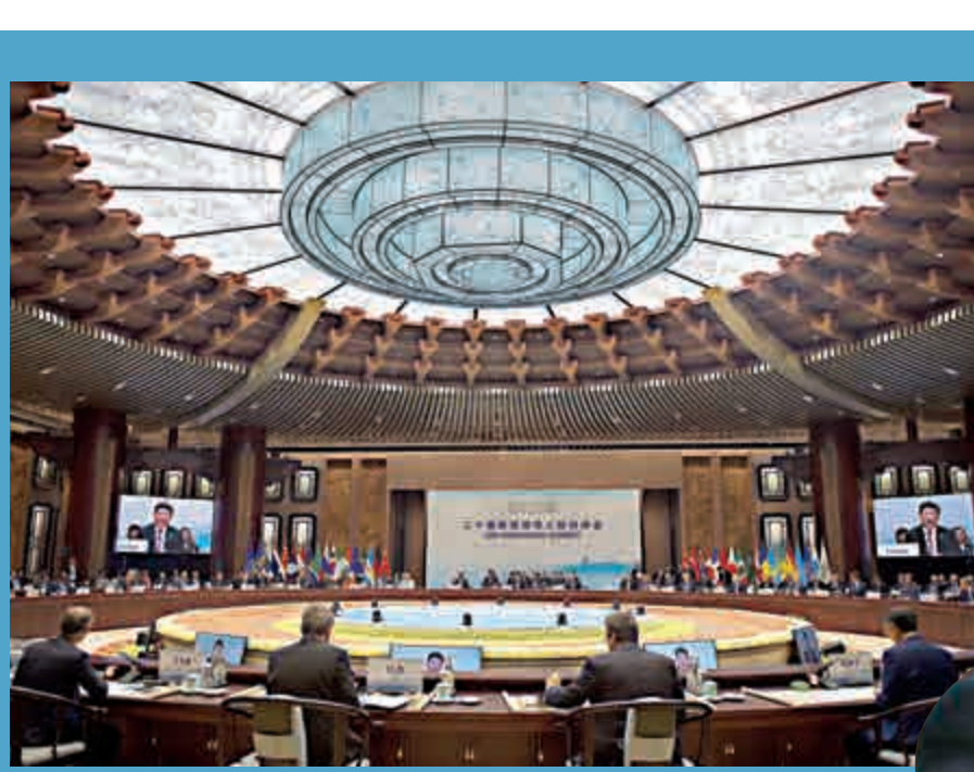
中國國家主席習近平出席二十國集團領導人杭州峰會並致開幕辭