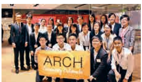
▲ACO共有22位學生參與東亞銀行於2016年7月舉辦的職場工作坊培訓活動

東亞銀行一直支持香港各類型的教育活動。在2015年，該行與聖雅各福群會於九龍大角咀九龍慈惠中心成立「東亞培賢社」，參加該計劃的基層家庭學童可獲得課後託管、功課輔導、膳食及參加各類藝術康樂活動的機會。此外，該行亦支持聖公會宗教教育中心舉辦的「東亞銀行親子閱讀證書獎勵計劃」，以促進閱讀的風氣及加強親子關係。