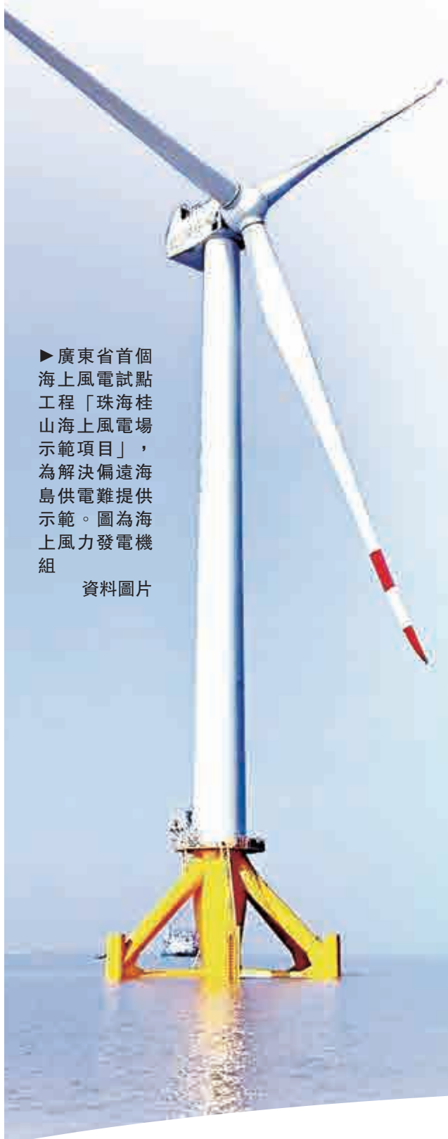
►廣東省首個海上風電試點工程「珠海桂山海上風電場示範項目」，為解決偏遠海島供電難提供示範。圖為海上風力發電機組