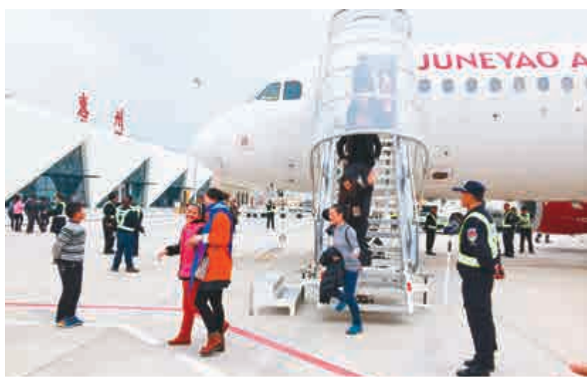
▲深圳第二機場或屬意布局惠陽。圖為航班抵達惠州機場 資料圖片

另一方面，入區港資企業也呈現體量大、質量高的特點。投資超過1000萬美元的港資企業佔總數的40%以上，港資企業平均註冊資本比區內企業平均註冊資本高62%，一大批香港優質本土機構如周大福、嘉里建設、港鐵集團、滙豐銀行、恒生銀行、渣打銀行、亞洲保理等相繼入駐。