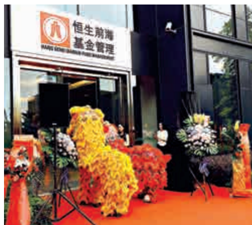
▲港資背景企業為前海貢獻了超過30%的稅收收入

前海管理局透露，經過6年實踐，前海拉動香港經濟轉型的槓桿效應逐漸顯現，投資前海的港資企業也呈現出良好勢頭。2014年至2016年上半年，註冊港資背景企業實現增加價值合計523.74億元，佔22.66%；其中，2016年上半年佔35.69%，顯示港資背景企業成為前海經濟發展的主要動力之一。從稅收來看，港資背景企業一直佔據較大份額，2014年至今均貢獻超過30%的稅收收入，已累計繳交稅金145.09億元，佔總體的32.87%。