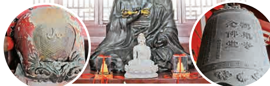
▲福州鶴巢寺的木魚