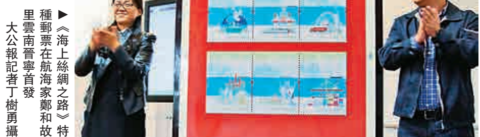
▶《海上絲綢之路》特種郵票在航海家鄭和故里雲南晉寧首發