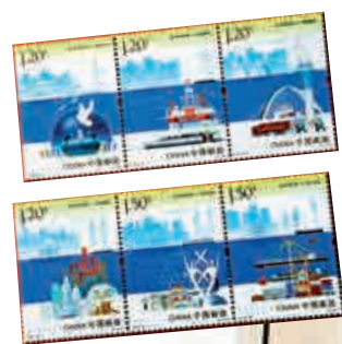
◀《海上絲綢之路》特種郵票1套6枚