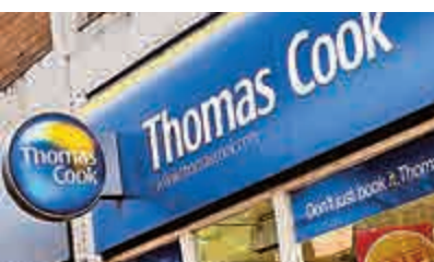
▲現代Thomas Cook門店網絡圖片

時隔110年，世界上第一家旅行社Thomas Cook又回到中國開店了，但與一百多年前不同的是，如今Thomas Cook面對的是競爭相當激烈的中國旅遊市場。