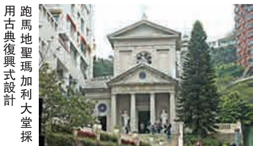
跑馬地聖瑪加利大堂採用古典復興式設計

三十年代又有另一種風格出現，就是中式外觀的教堂，譬如道風山基督教叢林、聖馬利亞堂和聖三一座堂等。這與當時教會推行本色化運動有關，希望透過教堂建築實現西方宗教與中國文化的融合，拉近教會與民衆的距離。但這種風格只是曇花一現，隨着戰雲密布戛然而止，戰後已不再盛行精雕細琢的功夫了。