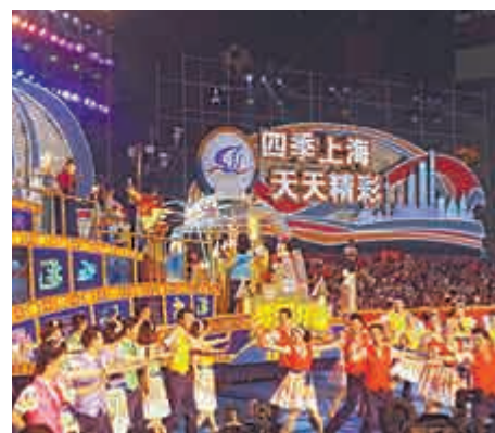
▲滬迪園花車領銜亮相

此次花車的主視角是「奇幻童話城堡」模型，米奇米妮和他們的夥伴們在花車上起舞，向觀眾熱情招手。緊接其後的還包括上海野生動物園的「熊貓寶寶」主題花車、台北城市特色觀光花車等。