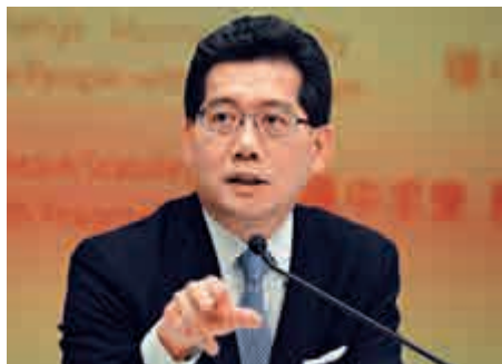
▲蘇錦樑表示，對新城交還牌照感失望 資料圖片

官會同行政會議就其申請作出決定前，新城仍須履行牌照責任和義務。通訊局會繼續監察新城，是否按牌照條款提供數碼聲音廣播服務，並遵守所有相關規管要求。