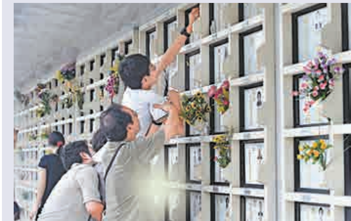
◀傳統的骨灰龕場猶如「無掩雞籠」，拜祭人潮於春秋二祭前兩、三星期開始湧現 資料圖片