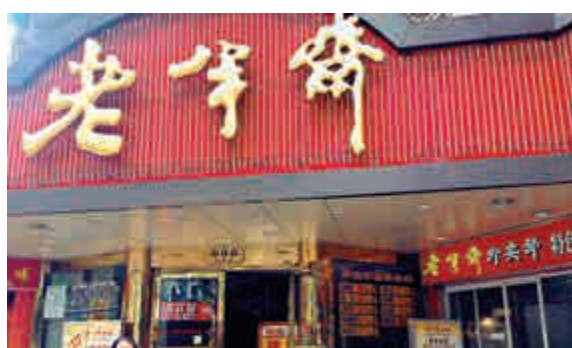
▲上海百年老店老半齋