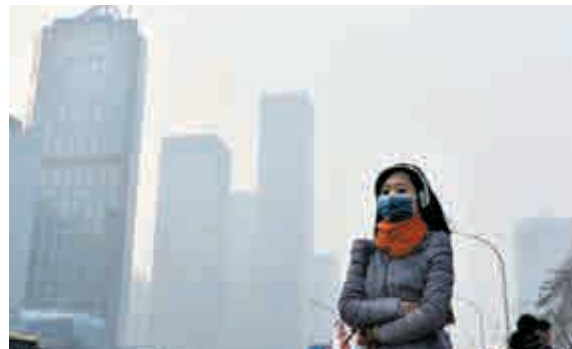
▲一名戴口罩的行人在霧霾下的北京街頭行走