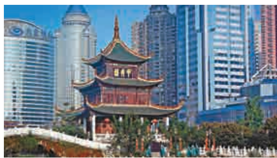
▲圖為貴州貴陽市內的甲秀樓，內有明清文人的題記碑刻和楹聯匾額多處 資料圖片