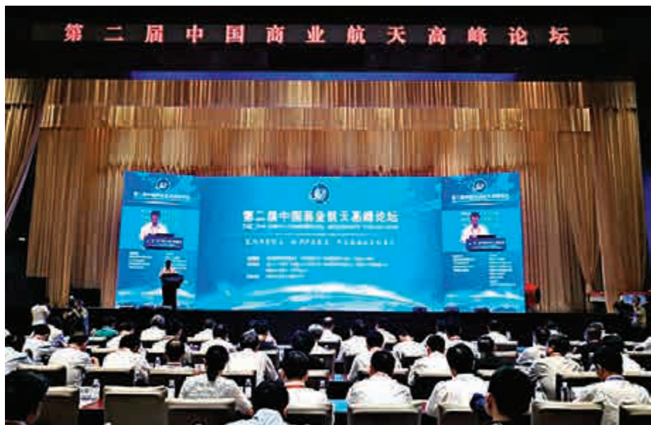
▲第二屆中國商業航天高峰論壇在武漢舉行