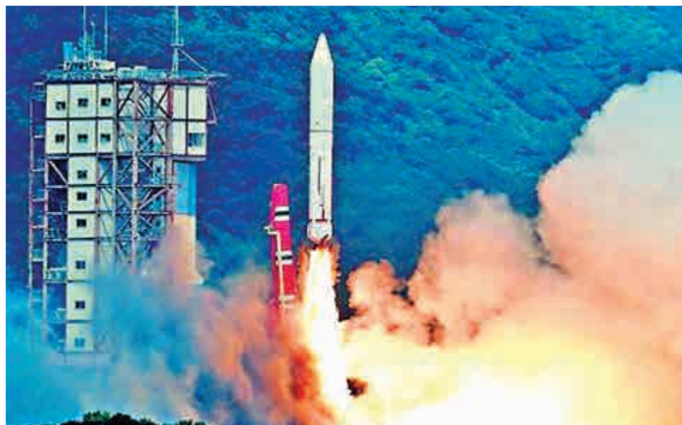
▲二〇一三年九月二十五日，中國在酒泉用「快舟」小型運載火箭，成功發射快舟一號衛星