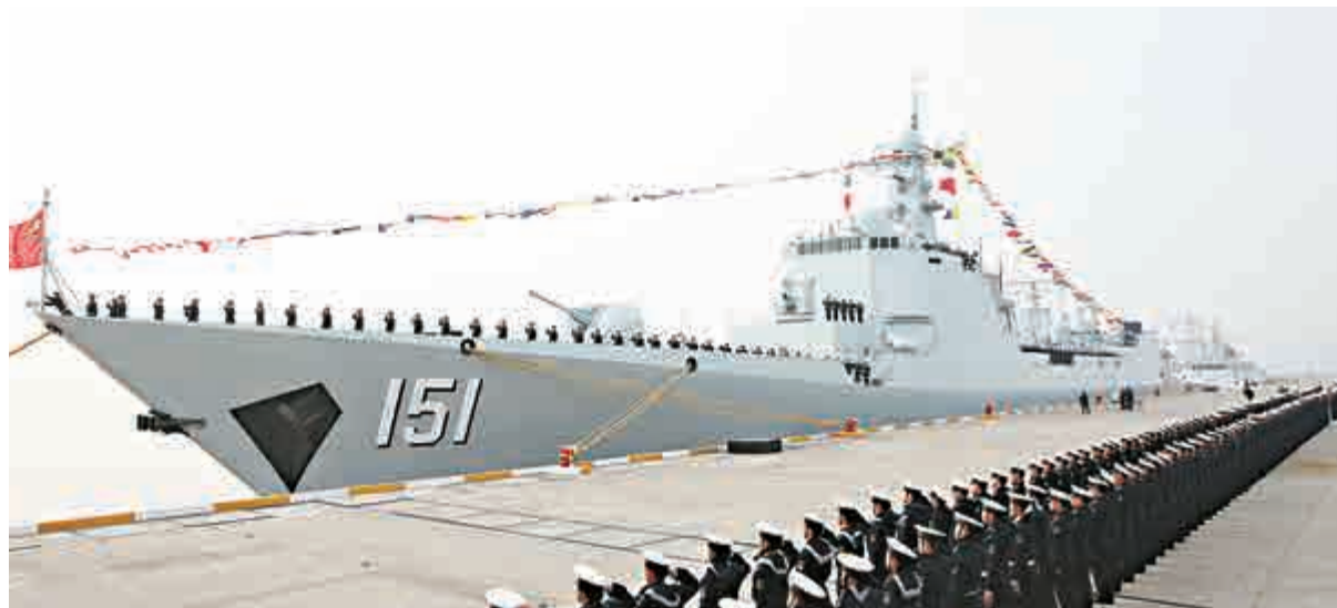
▲中方派出有「中華神盾」之稱的導彈驅逐艦——鄭州艦參演