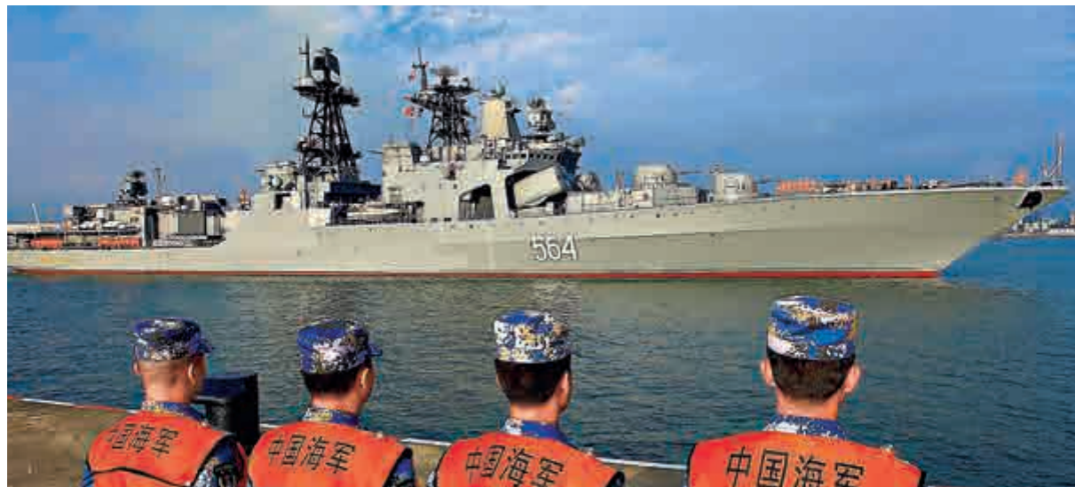
▲12日，中俄聯合軍演俄方參演艦艇抵達湛江。圖為「特里布茨海軍上將號」駛入碼頭