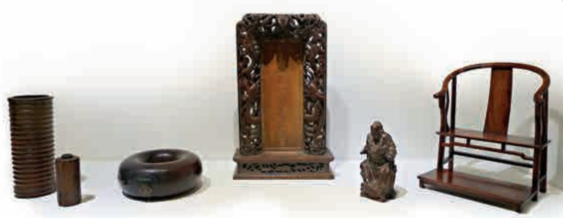
▲黃花梨祭祀用品