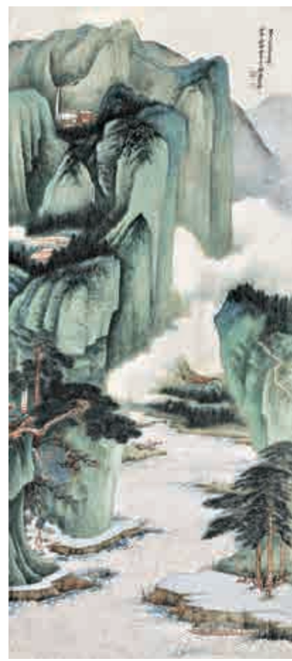
▲張大千作品《秋水春雲》

香港蘇富比中國書畫秋拍預展將於九月三十日至十月三日在金鐘太古廣場一座五樓「香港蘇富比藝術空間」預展，二〇一六年十月四日在香港會議展覽中心展覽廳三進行拍賣。詳情請瀏覽： http://www.sothebys.com/ 。