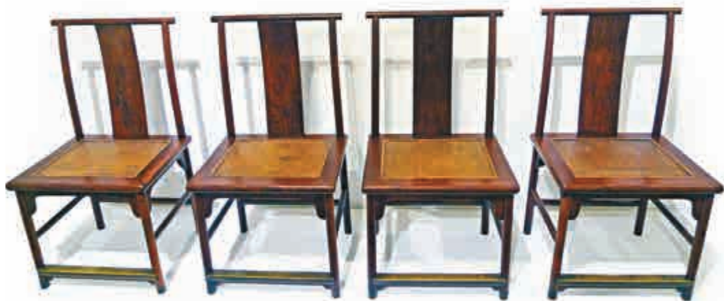
▲「黃花梨帶銅飾燈掛椅四張成堂」為典型的明式風格