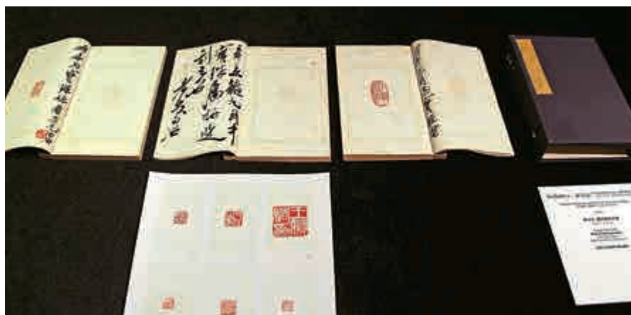
▲齊白石《贈胡寶珠印譜》原拓本，三冊一函

珠印譜》三冊一函，由自己治印，我們可以欣賞到他在篆刻方面的造詣外，亦可以從印章裏的印文中得知藝術家當時的人際關係。」這三冊印譜中，每冊都有題字，其中兩本有註明年份。而徐悲鴻的《自用印譜》有白綿紙精拓朱印八十三枚，每頁鈐一枚，未拓邊款，則徐悲鴻親錄閒章釋文。譜中治印者十七人，集合了當時大江南北的篆刻家，如壽石工、張壽丞、齊白石、楊仲子等。特別之處在於若知治印者，徐悲鴻會親筆標明其名，印材特殊者亦有標出。