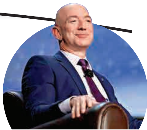
▲亞馬遜創辦人貝佐斯

一直以來，貝佐斯對Blue Origin的發展動向較為低調，鮮少主動曝光關鍵信息。然而，此次他主動發推，並再次重申Blue Origin「商用衛星及載人太空」的目標定位，不得不得引人引發聯想，貝佐斯此舉實則正是劍指剛剛發生火箭爆炸事件的SpaceX創始人埃隆·馬斯克。