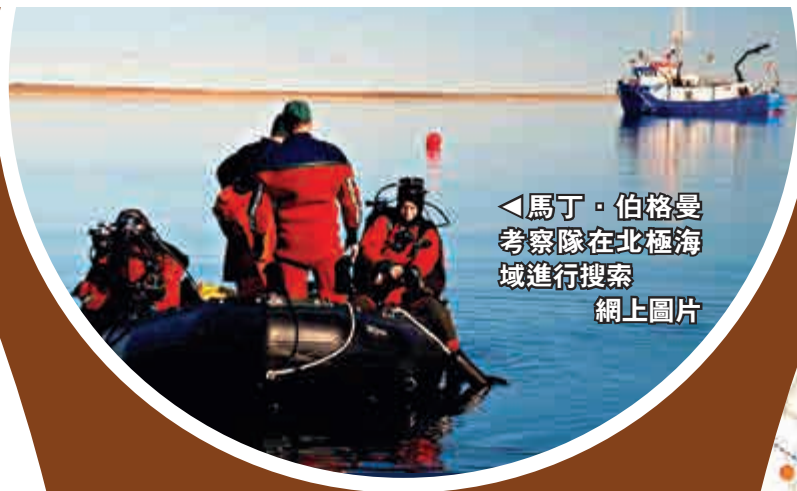
▲馬丁·伯格曼考察隊在北極海域進行搜索

更近期的研究則是認為，富蘭克林船隊的罐裝食物酸性不足以讓船員鉛中毒，屍體裏的鉛應該更有可能是來自船內部的管線。鉛中毒影響隊員的健康及判斷力，儘管殺死水手的元兇是肺炎，但可能也是導致隊員不能成功逃生的原因之一。