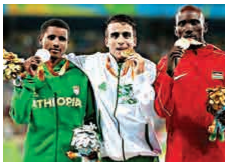
▲殘奧1500米獲獎者合照 網上圖片