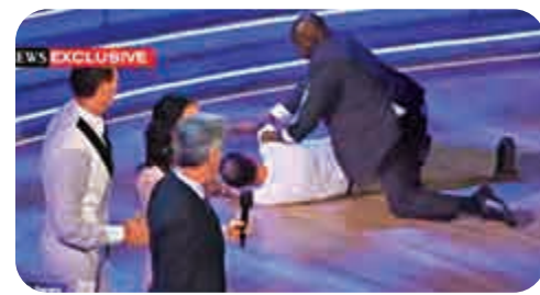
▲示威者衝上舞台被保安制服 網上圖片