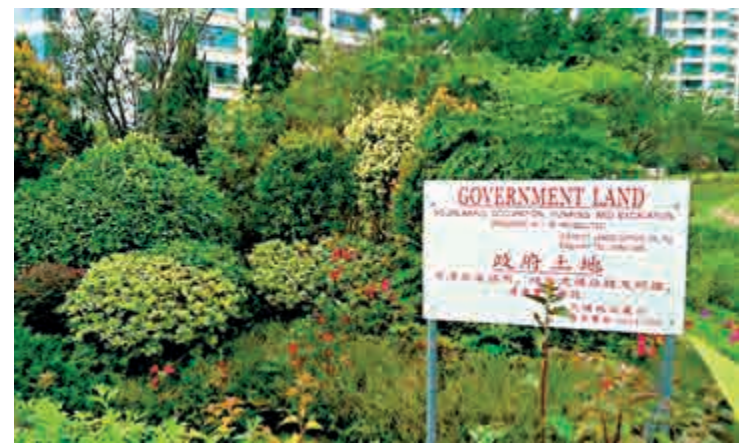
▲申訴專員公署發布調查報告批評地政總署放任非法佔用官地