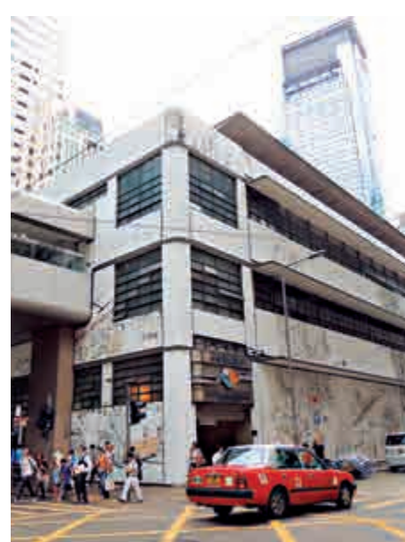
▲中環街市活化計劃獲城規會通過

，市建局發言人表示高興，將在短期內向屋宇署提交修訂建築圖則，預備開展工程，並繼續與地政總署跟進批地事宜。