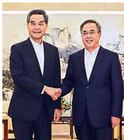
行政長官梁振英（左）昨在粵港合作聯席會議第十九次會議前與廣東省委書記胡春華（右）會面