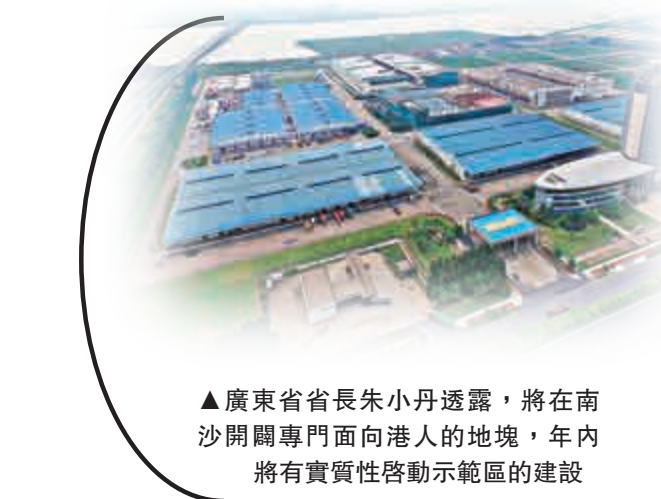
廣東省省長朱小丹透露，將在南沙開闢專門面向港人的地塊，年內將有實質性啓動示範區的建設

朱小丹表示，廣東歡迎香港工商界參與廣東自貿試驗區開發建設。目前廣東將按照國務院批覆的《中國（廣東）自由貿易試驗區總體方案》要求，進一步深化與港澳在各領域的合作，降低准入門檻，為香港工商界提供更具活力的發展平台和更為便利的發展空間，努力將廣東自貿試驗區建成粵港澳深度合作示範區。下一階段，廣東將加強與香港特區政府、香港工商界、企業界的對接溝通。