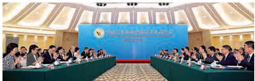
梁振英（左七）與朱小丹（右七）昨天共同主持粵港合作聯席會議第十九次會議

深化旅遊合作也是雙方服務貿易合作的重頭戲。當前廣州南沙郵輪母港開工建設、深圳蛇口太子港郵輪母港即將建成啓用，以此為契機雙方將加強郵輪旅遊合作，聯合開發面向東南亞的「一程多站」郵輪航線。