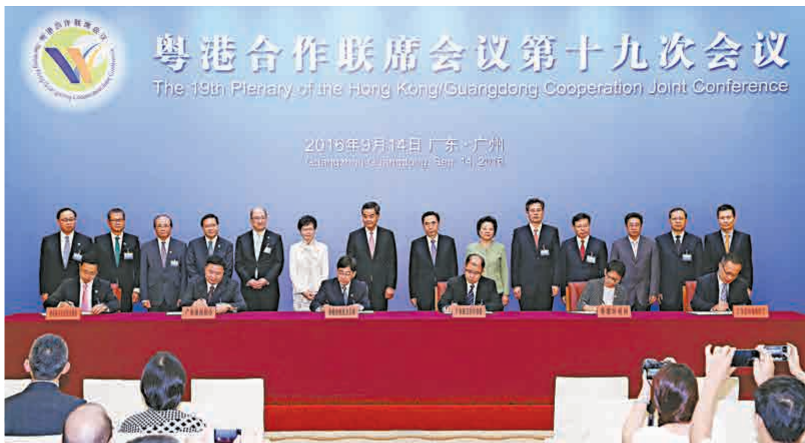
行政長官梁振英（後排左七）、政務司司長林鄭月娥（後排左六）、廣東省省長朱小丹（後排右七）與兩地官員見證粵港合作協議簽署儀式

第十九次粵港聯席會議由行政長官梁振英和廣東省省長朱小丹共同主持。會上，政務司司長林鄭月娥、廣東省副省長何忠友及雙方其他官員，分別彙報了粵港合作聯席會議第十八次會議以來的合作進度及成果，並確定未來一年攜手參與「一帶一路」建設、青年交流、旅遊、環保、教育等多個領域合作的工作重點，粵港雙方會後還簽署了包括《粵港攜手參與國家「一帶一路」建設合作意向書》在內的九份合作協議，在未來一年粵港兩地會繼續攜手合作，做好各個範疇的工作。