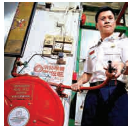
▲消防處研發出簡化版「折衷式喉轆系統」，令舊樓能合乎現代化消防要求