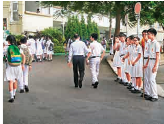
▲有學生早前在校外派傳單而被校方約見 資料圖片

另外，朱於本年書展首日，飛奔到場內購買宅男女神「雞排妹」鄭家純的最新寫真集，但發現寫真仍在印刷中，最終撲空。惟朱其後獲安排與「雞排妹」見面，並獲對方贈送一本有唇印及親筆簽名的寫真，因而被稱為「雞排妹」香港頭號粉絲。