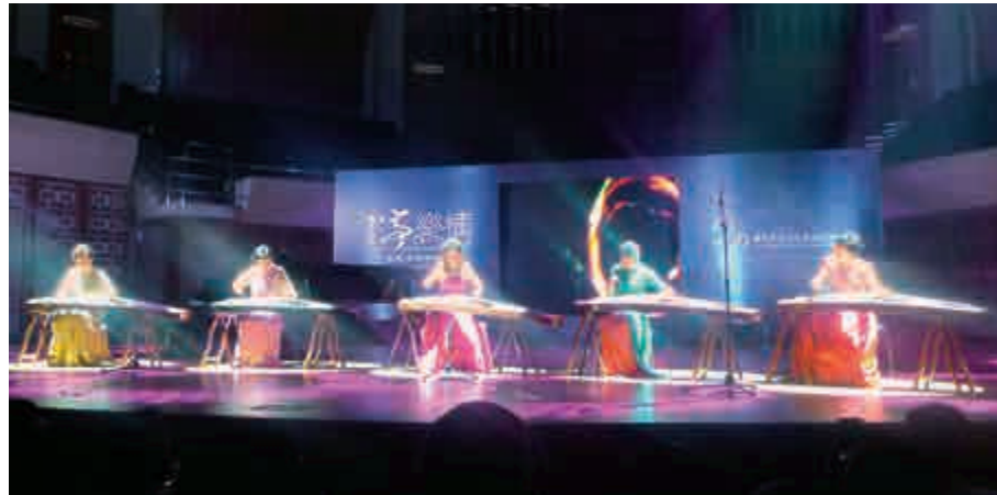
▲五位古箏名家同台合奏《漁舟唱晚》