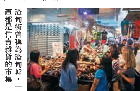
渣甸街舊稱「渣甸墟」，一直都是售賣雜貨的市集

今天，日式百貨的風潮已過，大丸已於一九九八年結業，松坂屋在同年撤走。三越亦因與中心拆卸而離開香港，如今只剩下崇光百貨留守銅鑼灣。渣甸早已將商業重心轉移中環，但銅鑼灣仍有不少街道名稱見證了渣甸和渣甸大班的足跡。